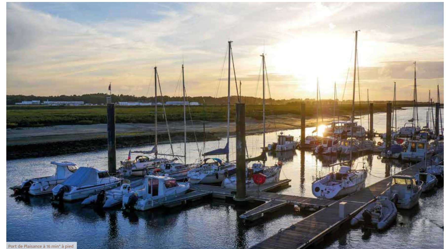
Port de Plaisance à 16 min* à pied