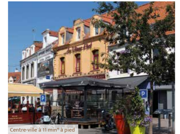
Centre-ville à 11 min* à pied

"Jardins d'Opale" s'inscrit dans la continuité d'un quartier pavillonnaire calme et qualitatif. Au sein d'une ruelle intimiste, la résidence s'accorde un emplacement privilégié, conjuguant à la fois douceur de vivre et vie pratique, proche de toutes les commodités du quotidien.