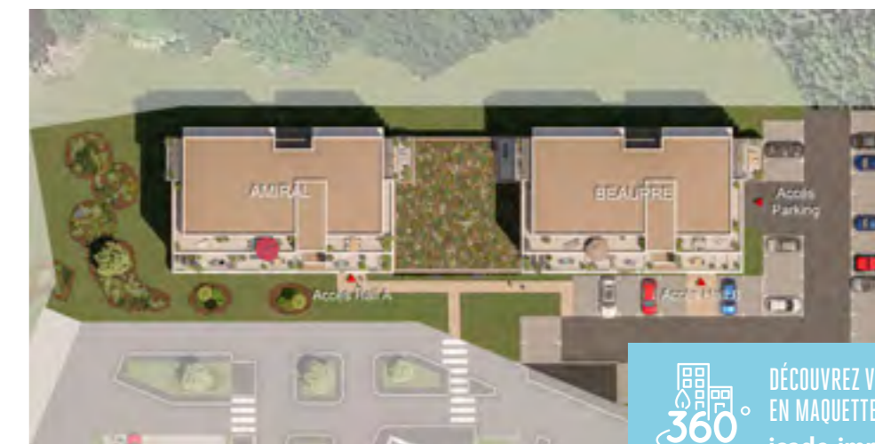
*Lots A61 et B61

Espace boisé à proximité L'expérience d'un cadre de vie vert et vivant