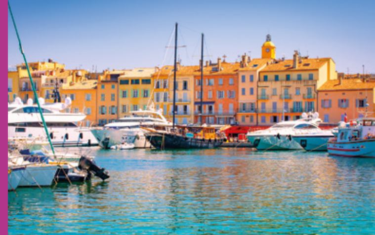
Façades colorées et yachts luxueux sous le ciel radieux méditerranéen