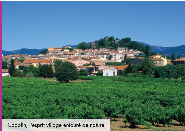
Cogolin, l'esprit village entouré de nature