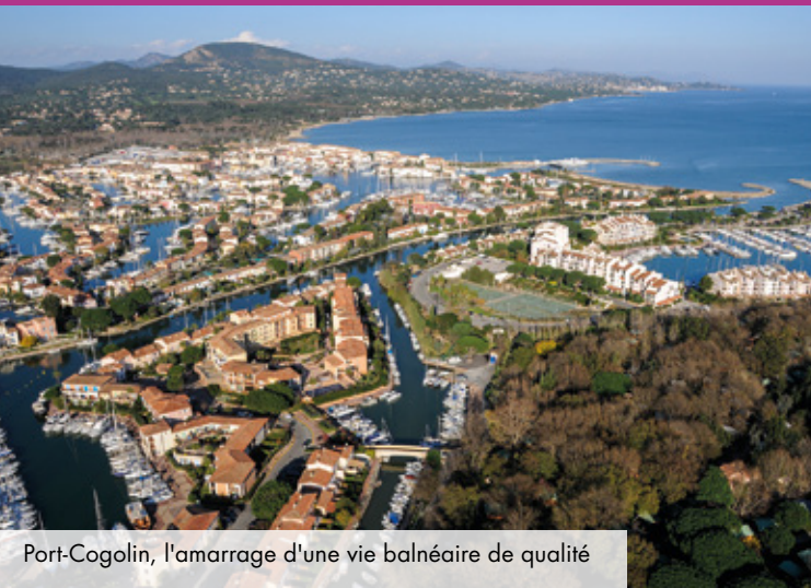
Port-Cogolin, l'amarrage d'une vie balnéaire de qualité