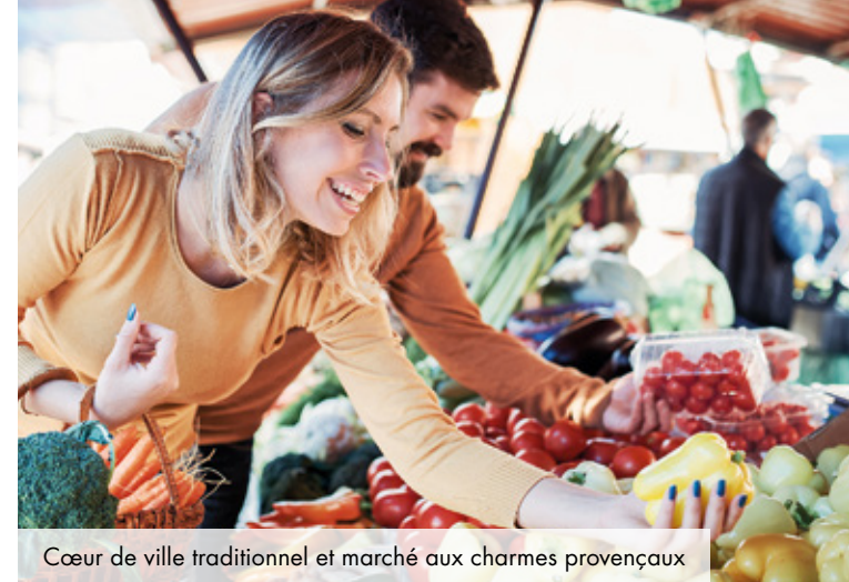
Cœur de ville traditionnel et marché aux charmes provençaux

Cogolin s'épanouit au cœur du Golfe de Saint-Tropez où s'entremêlent plages emblématiques, villages pittoresques, golfs et marinas, casinos, festivals... entretenant le prestige. La ville déploie une harmonie toute naturelle avec son paysage paisible blotti par les rivages de la Méditerranée.