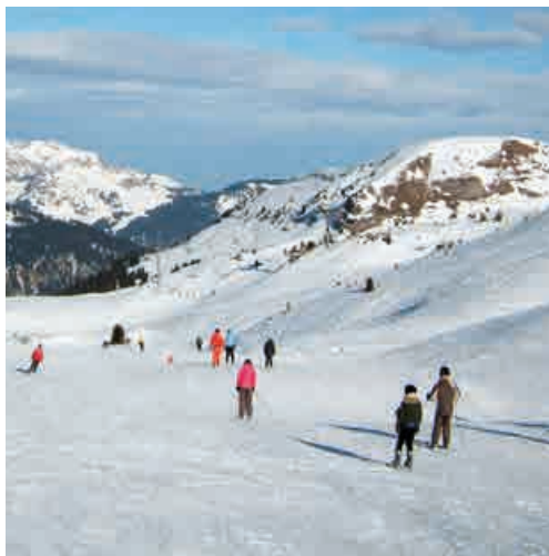
Station de ski - Monts Jura