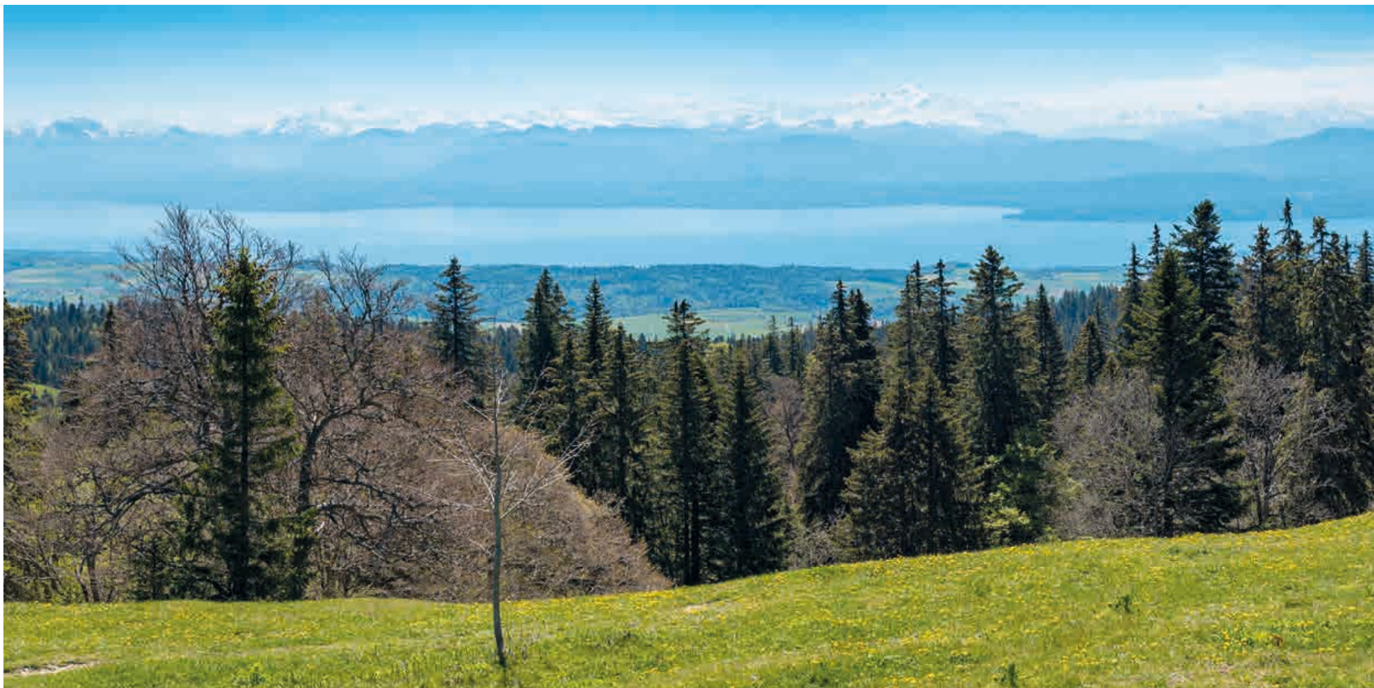
Vue depuis les hauteurs de Crozet