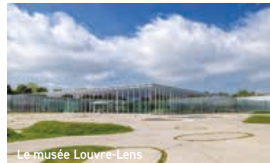
Le musée Louvre-Lens

Au cœur d'une aire urbaine comptant près de 600 000 habitants, l'une des plus densément peuplées de France, Lens bénéficie d'une exceptionnelle situation géographique. Lille et sa puissante métropole, mais aussi Le Touquet-Paris-Plage, station balnéaire renommée, en sont proches.