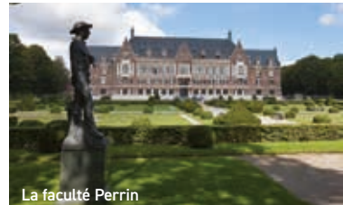
La faculté Perrin