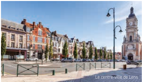
Le centre-ville de Lens