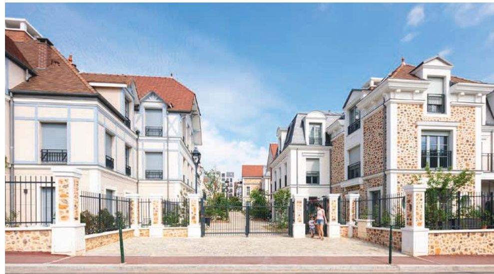
Allée de Meudon - CLAMART | 92