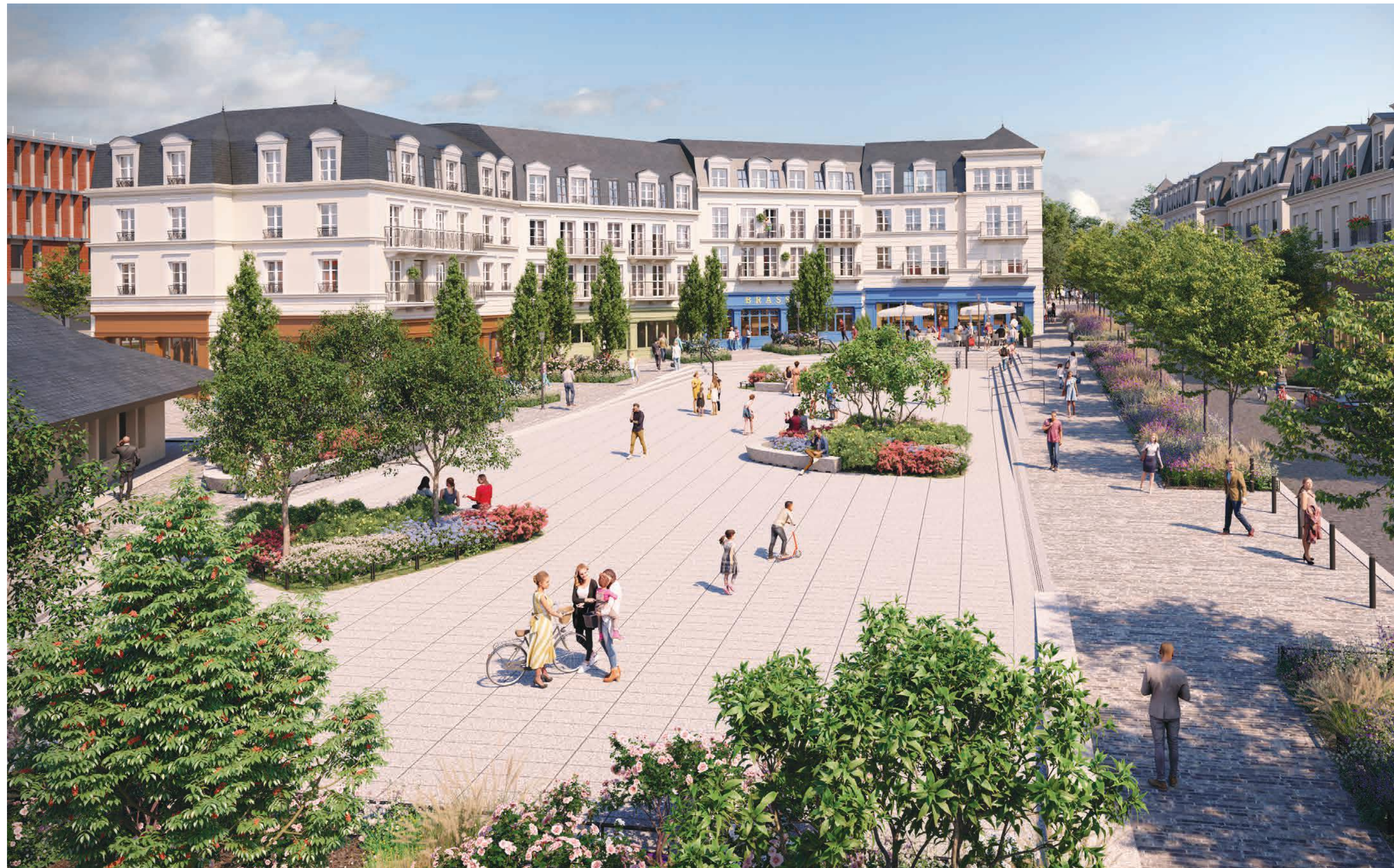
Vue de la place réaménagée