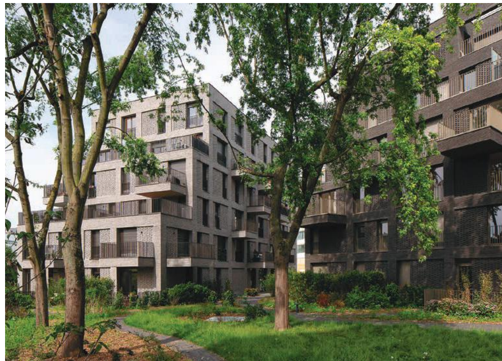
10 rue Danton - PANTIN | 93