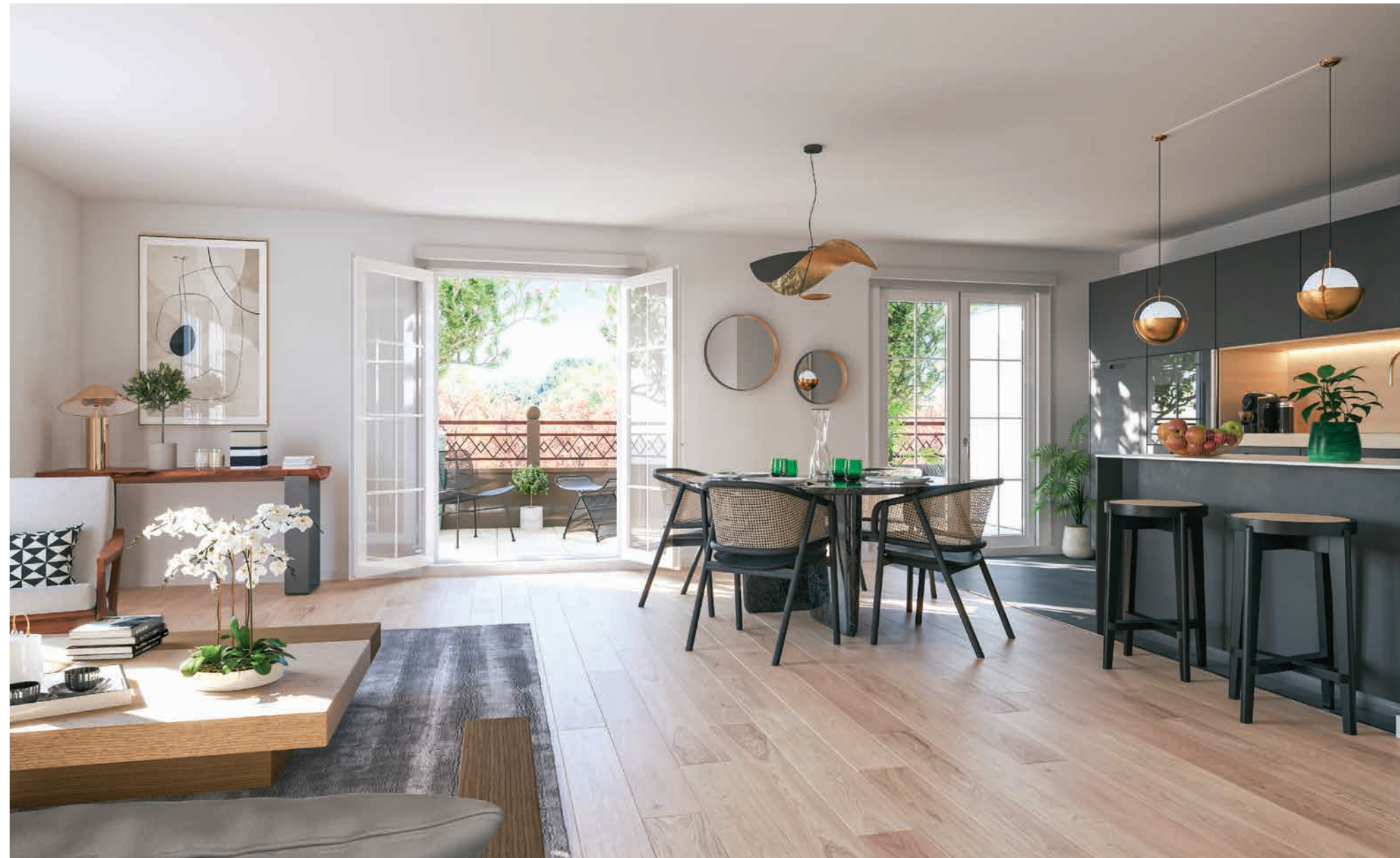
Vue sur le séjour d'un appartement 5 pièces