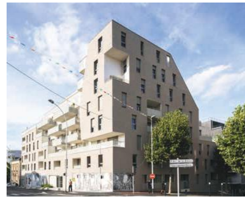
21 Jean Jaurès - GENTILLY | 94