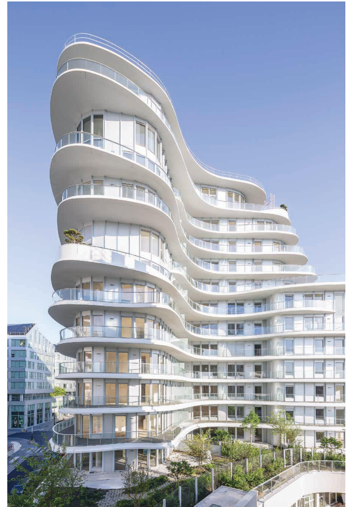
Unic - PARIS | 17

Emerige, société par actions simplifiée au capital de 3 457 200 €, immatriculée au RCS de Paris sous le numéro 350 439 543 - Siège social : 121 avenue de Malakoff 75116 Paris - Architecte : Breitman & Breitman Architectes - Perspectivistes : Miysis, Visual-FL, Scenesis, Citallios - Crédit photos : Grégoire Créton - Illustrations non contractuelles à caractère d'ambiance - Document et informations non contractuels - Réalisation : mark-us - 09/2021