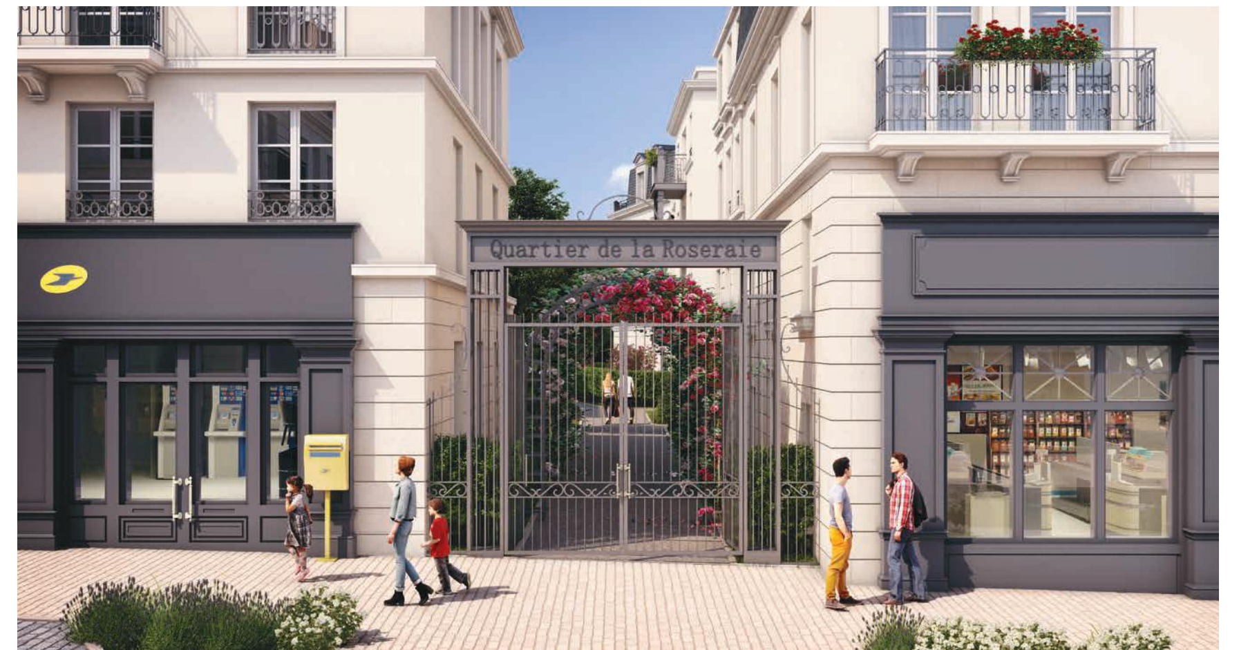
Vue d'une entrée de la résidence

En hommage à la Roseraie, une essence de rose sera spécialement créée pour l'inauguration de la résidence.