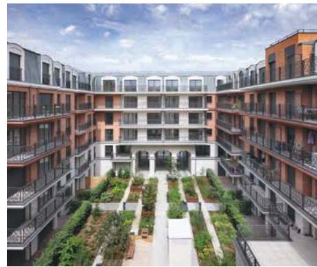
Quartier des arts - PUTEAUX | 92

Après avoir inauguré en 2019 "Unic", situé dans l'écoquartier des Batignolles (Paris 17 e ) et conçu par les architectes M.A.D et Christian Biecher, Emerige a livré de nombreux autres projets comme "10 rue Danton" à Pantin, une résidence aux abords du Canal de l'Ourcq imaginée par le cabinet Avenier Cornejo, le projet "Allée de Meudon" à Clamart pensé par Jenny & Lakatos, la résidence "Quartier des arts" à Puteaux élaborée par le Cabinet Vigneron ou encore "21 Jean Jaurès" à Gentilly imaginée par Daquin & Ferrière Architecture.