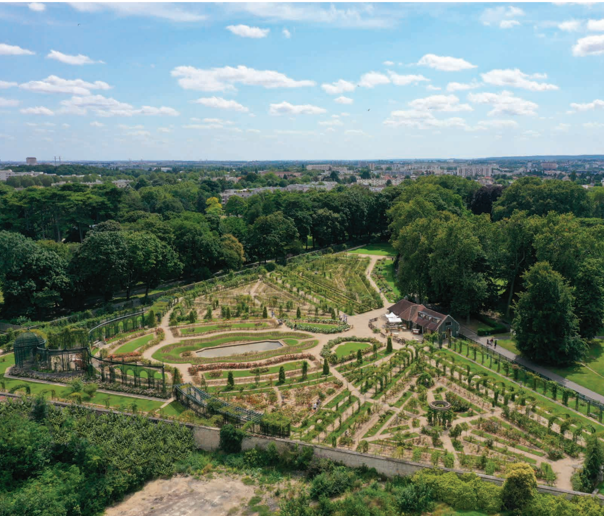
Vue du parc départemental de la Roseraie