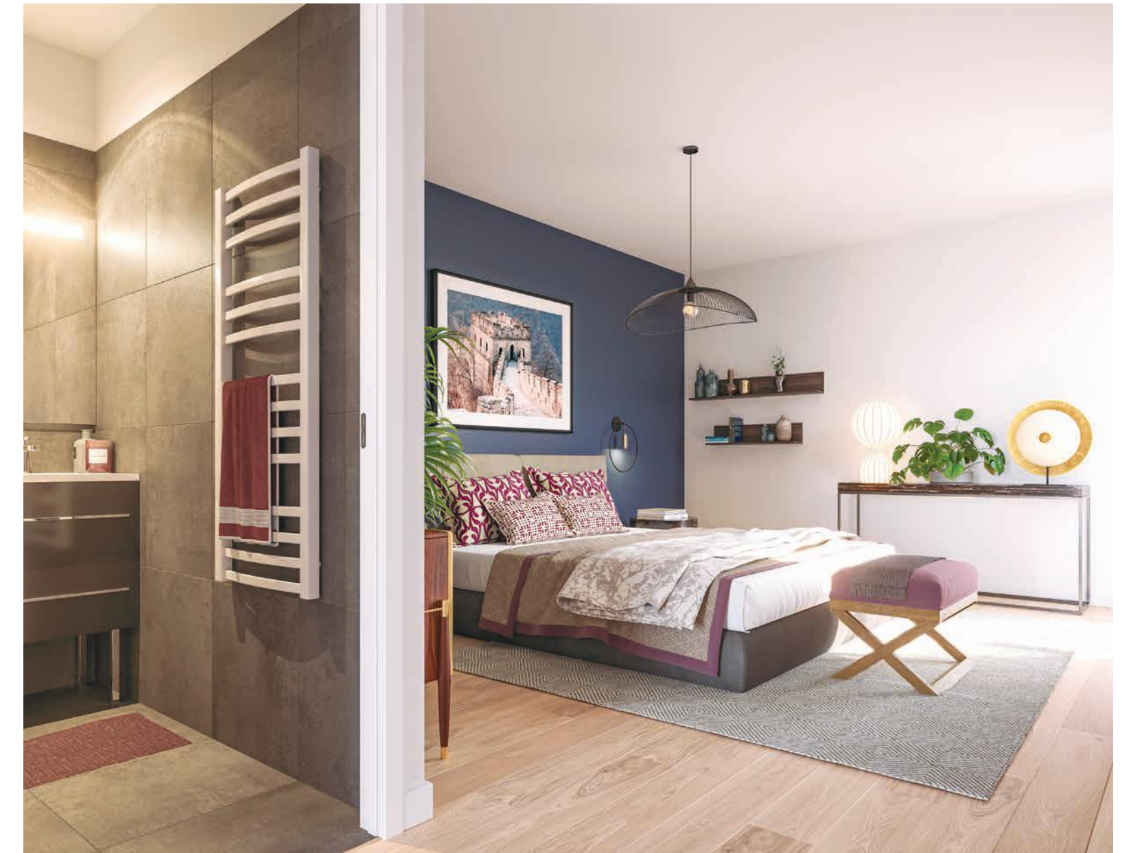
Vue sur une suite parentale

La résidence, labellisée RT 2012, est optimisée pour éviter les pertes de chaleur et ainsi bénéficier d'une réduction de consommation énergétique.