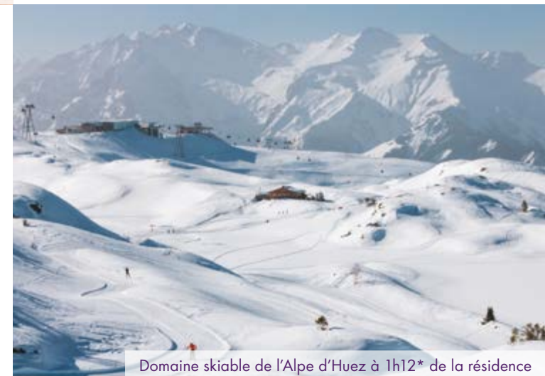
Domaine skiable de l'Alpe d'Huez à 1h12* de la résidence