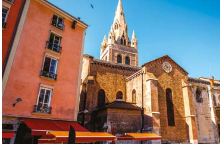
Place Saint-André, entre authenticité et modernité, à 11 min* de la résidence