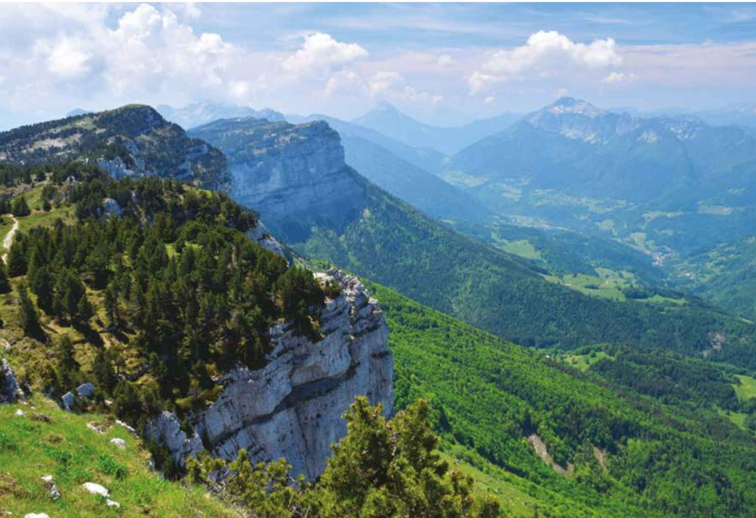
Le massif de la Chartreuse à 52 min* en voiture de la résidence