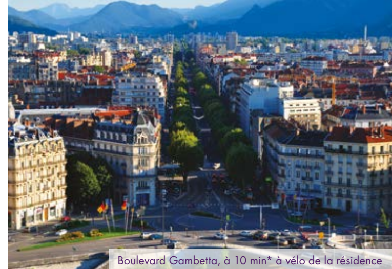
Boulevard Gambetta, à 10 min* à vélo de la résidence