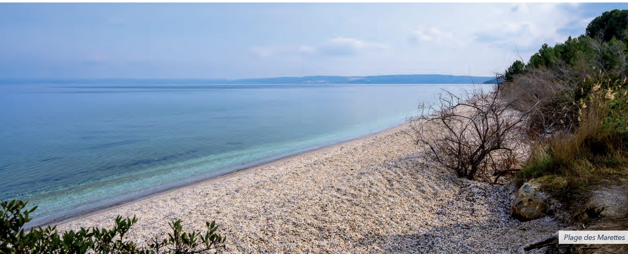
Plage des Marettes