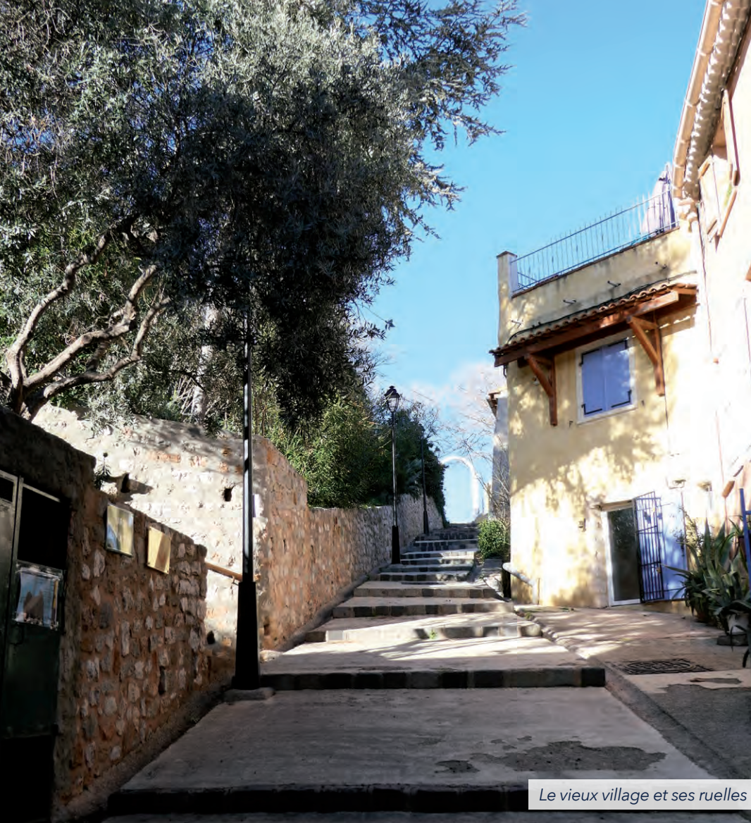
Le vieux village et ses ruelles