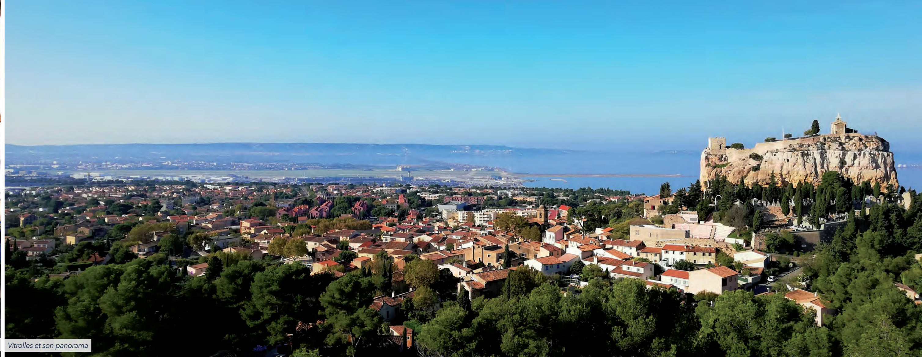
Vitrolles et son panorama