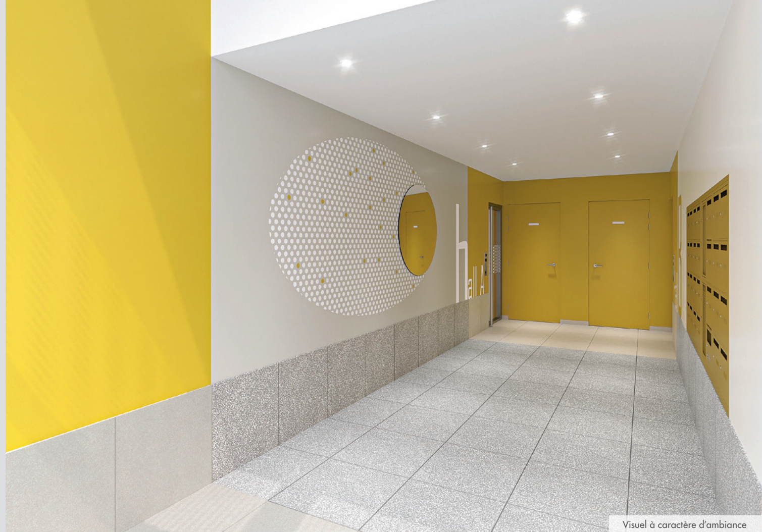
Visuel à caractère d'ambiance