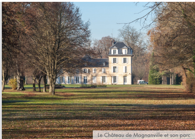
Le Château de Magnanville et son parc