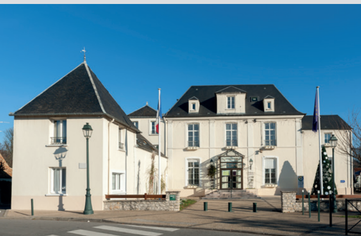
Hôtel de ville de Magnanville