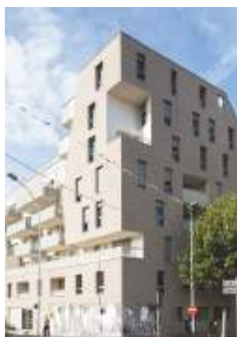
21 Jean Jaurès - GENTILLY | 94