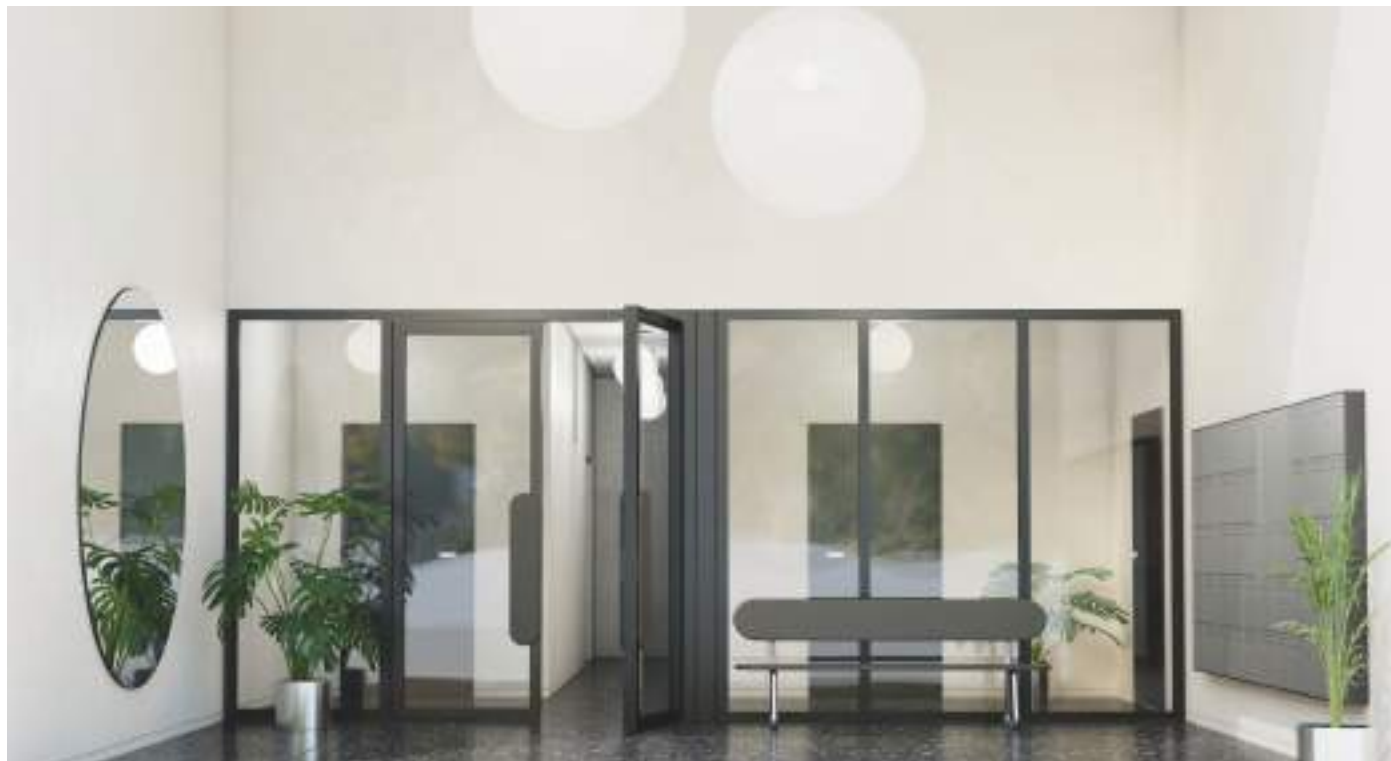
Vue d’un hall de la résidence

Enfin, aux derniers étages, un volume émerge et se démarque par son traitement différent de la façade, accueillant des logements vitrés prolongés de grands balcons ou de jardins d’hiver. La nuit tombée, il s’éclaire et devient une lanterne urbaine au sein du quartier.