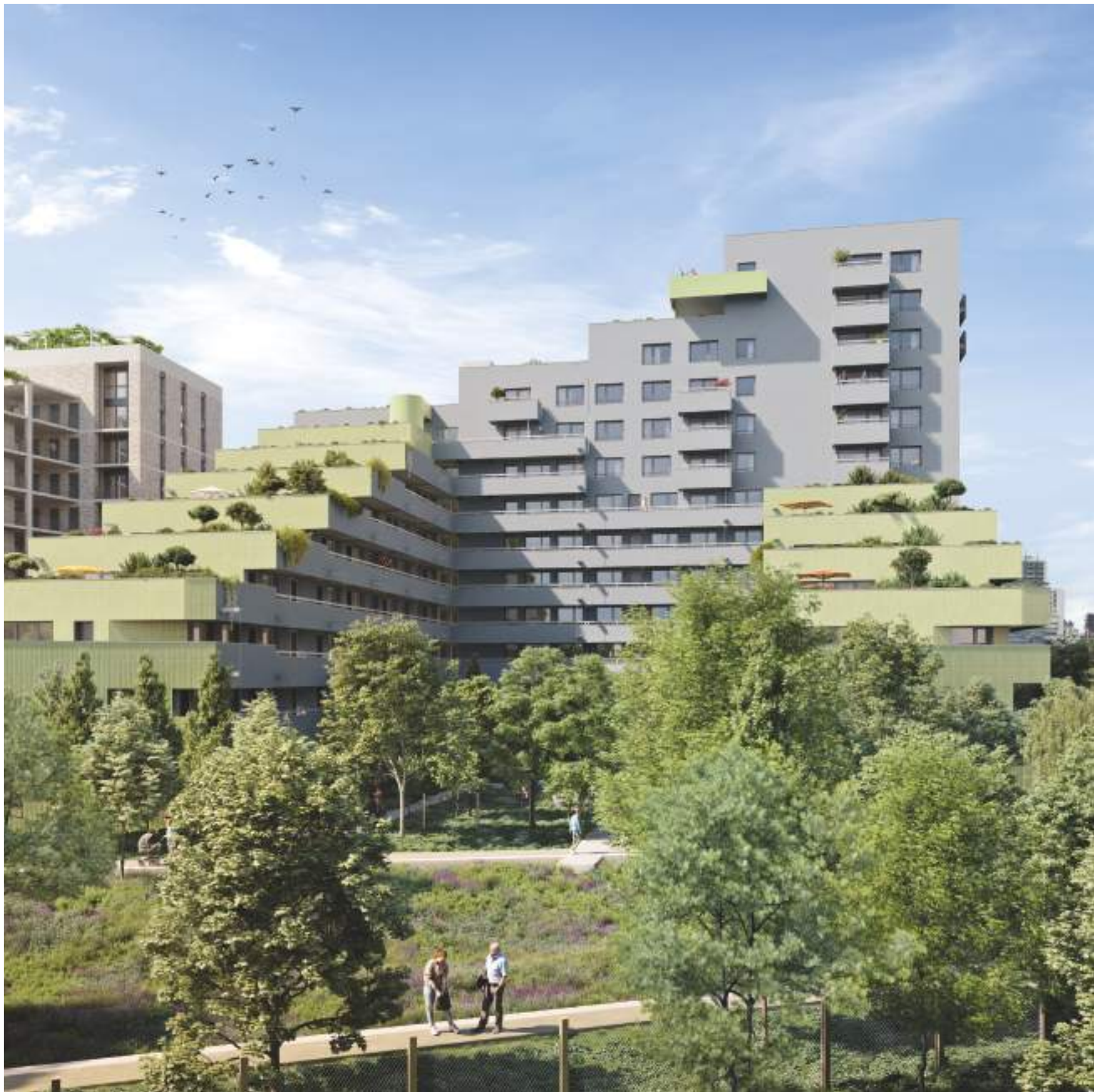
Vue sur la façade de la résidence « Seine 2 » depuis le jardin central