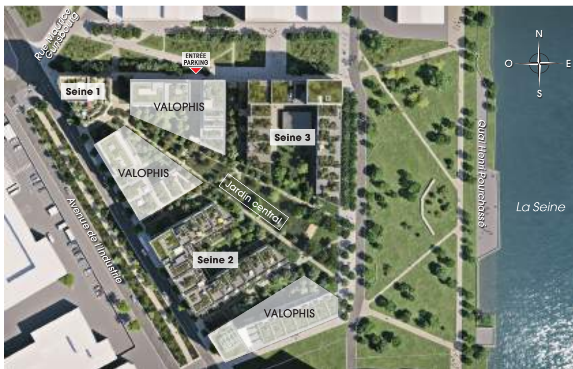
Plan de masse

Les bâtiments Seine 1, 2 et 3 sont composés de logements locatifs intermédiaires et en accession libre. Les bâtiments Valophis sont composés de logements locatifs sociaux.