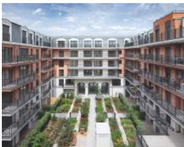
Quartiers des Arts - PUTEAUX | 92