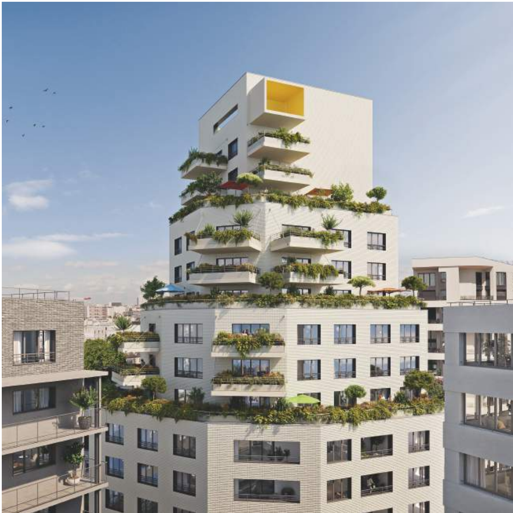
Vue sur la façade de la résidence « Seine 1 » depuis le jardin central