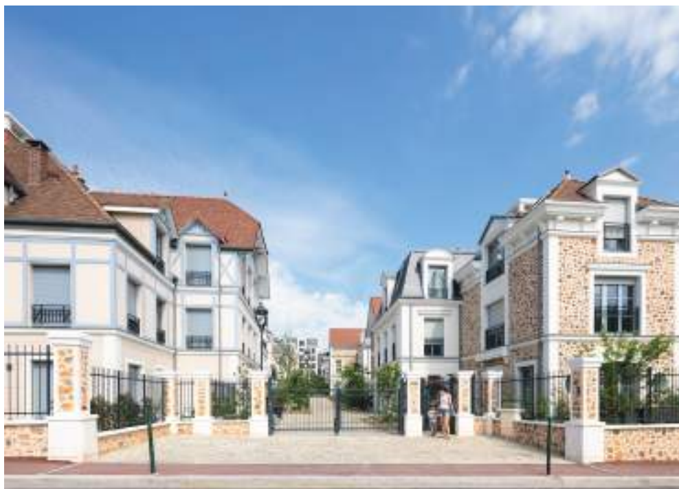
Allée de Meudon - CLAMART | 92