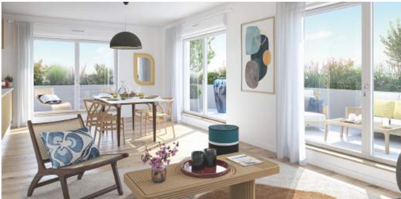
Vue de l’intérieur d’un appartement 3 pièces

Dotés d’un niveau de confort exceptionnel, les appartements s’inscrivent dans une démarche de haute qualité environnementale, répondant aux exigences de la certification NF Habitat HQE.