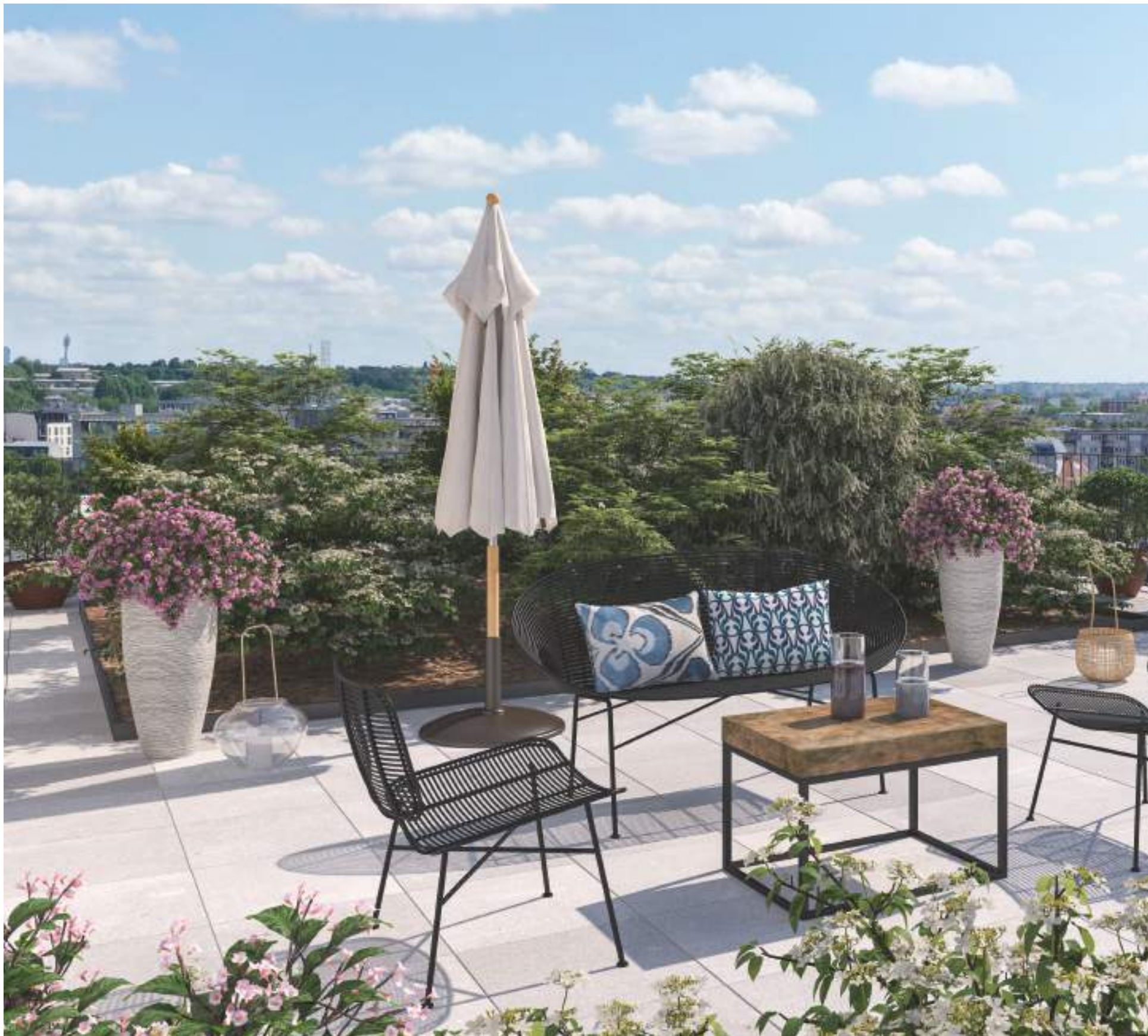
Vue sur la terrasse partagée de la résidence « Seine 3 »