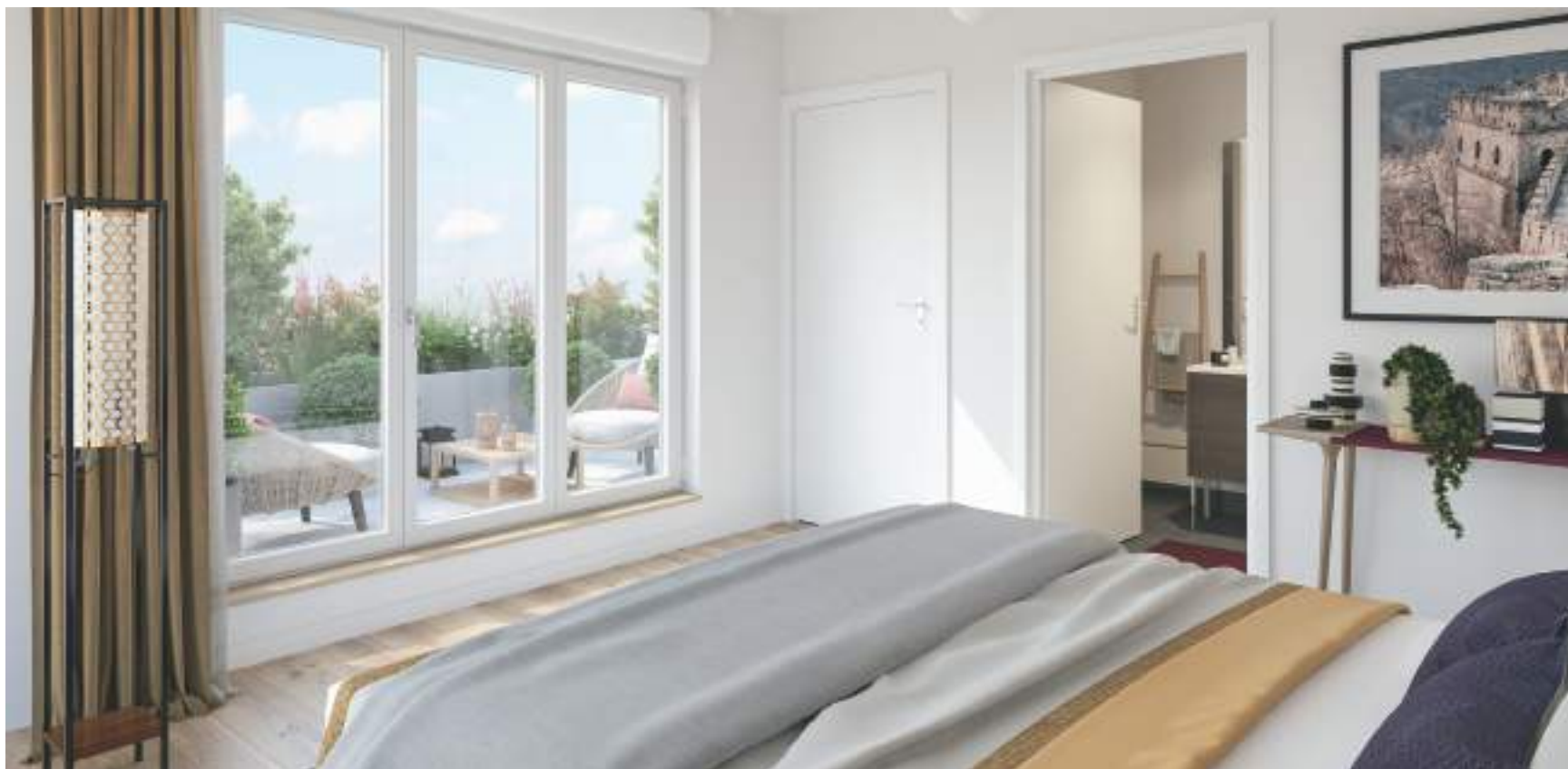
Vue sur la suite parentale d'un appartement de la résidence « Seine 1 »