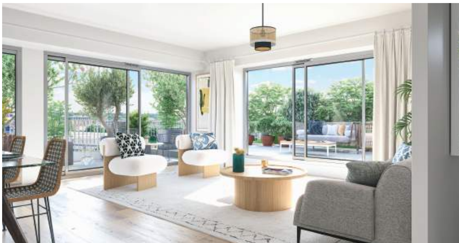
Vue sur le séjour d'un appartement 5 pièces duplex