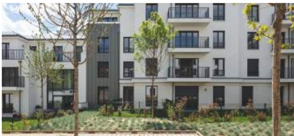
1 rue Roussel - SAINT-MAUR-DES-FOSSÉS | 94

Pour Emerige, chaque nouveau projet immobilier répond à une quête d'exigence en matière de qualité et de durabilité architecturale. Tous conçus comme des lieux de vie partagés, ils visent en priorité la satisfaction des habitants et des usagers pour un mieux vivre ensemble.