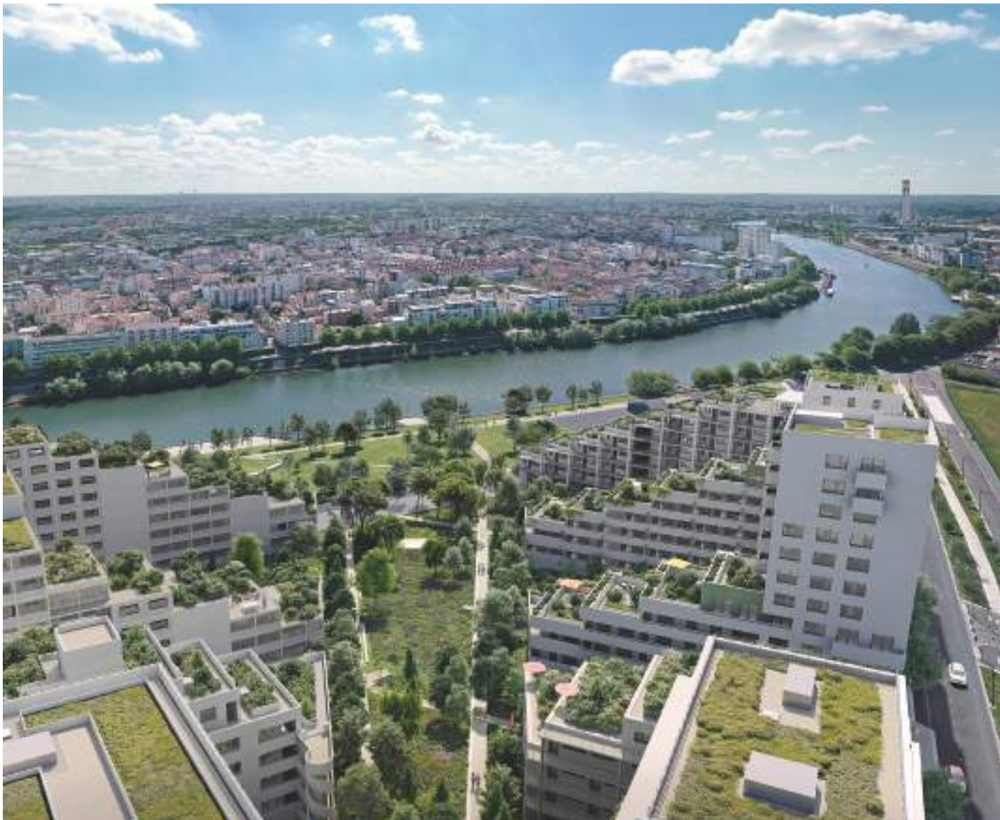
Vue de haut sur l'ensemble résidentiel regardant les bords de Seine

L'architecture des bâtiments est rythmée par une succession de balcons, terrasses, jardins suspendus et jardins d'hiver qui descendent progressivement vers la Seine, offrant des vues dégagées vers le ciel et sur le grand paysage fluvial. Au gré des saisons, il est plaisant de bénéficier de vues reposantes sur l'eau ou de vivre aux premières loges du jardin paysager central.