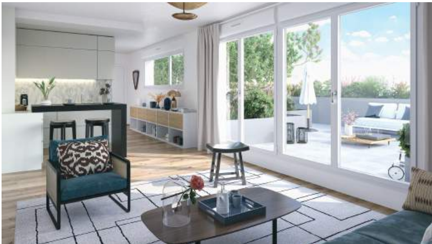
Vue sur le séjour d'un appartement 3 pièces

Depuis l'avenue de l'Industrie, deux halls traversants se prolongent vers le cœur d'îlot. Une entrée, plus discrète, est aussi possible par les venelles bordant le bâtiment. Le rez-de-chaussée comprend un grand local vélo clos et sécurisé de 185 m 2 . Il accueille aussi des locaux d'activité également répartis au premier étage.