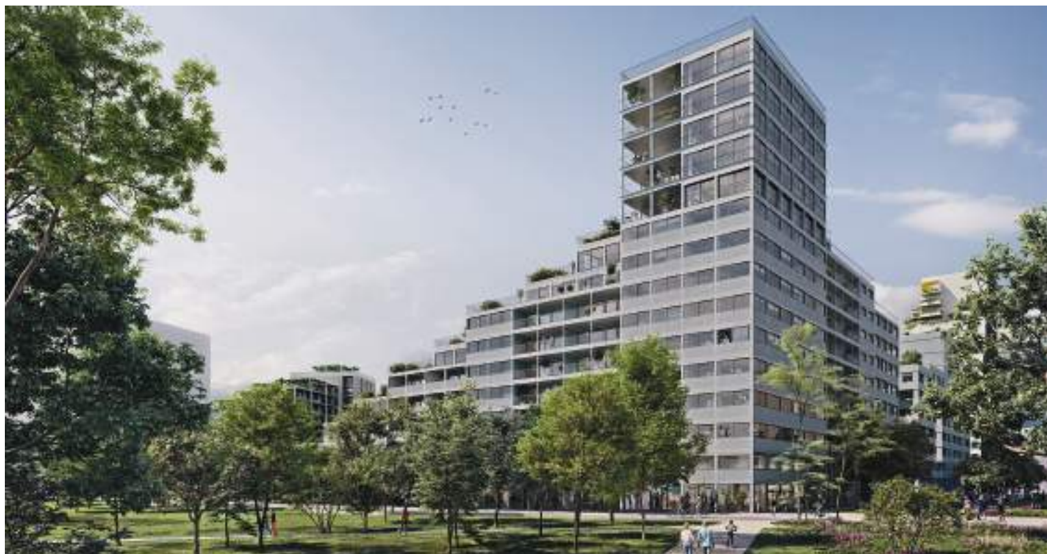
Vue sur la façade de la résidence « Seine 3 » depuis les berges réaménagées