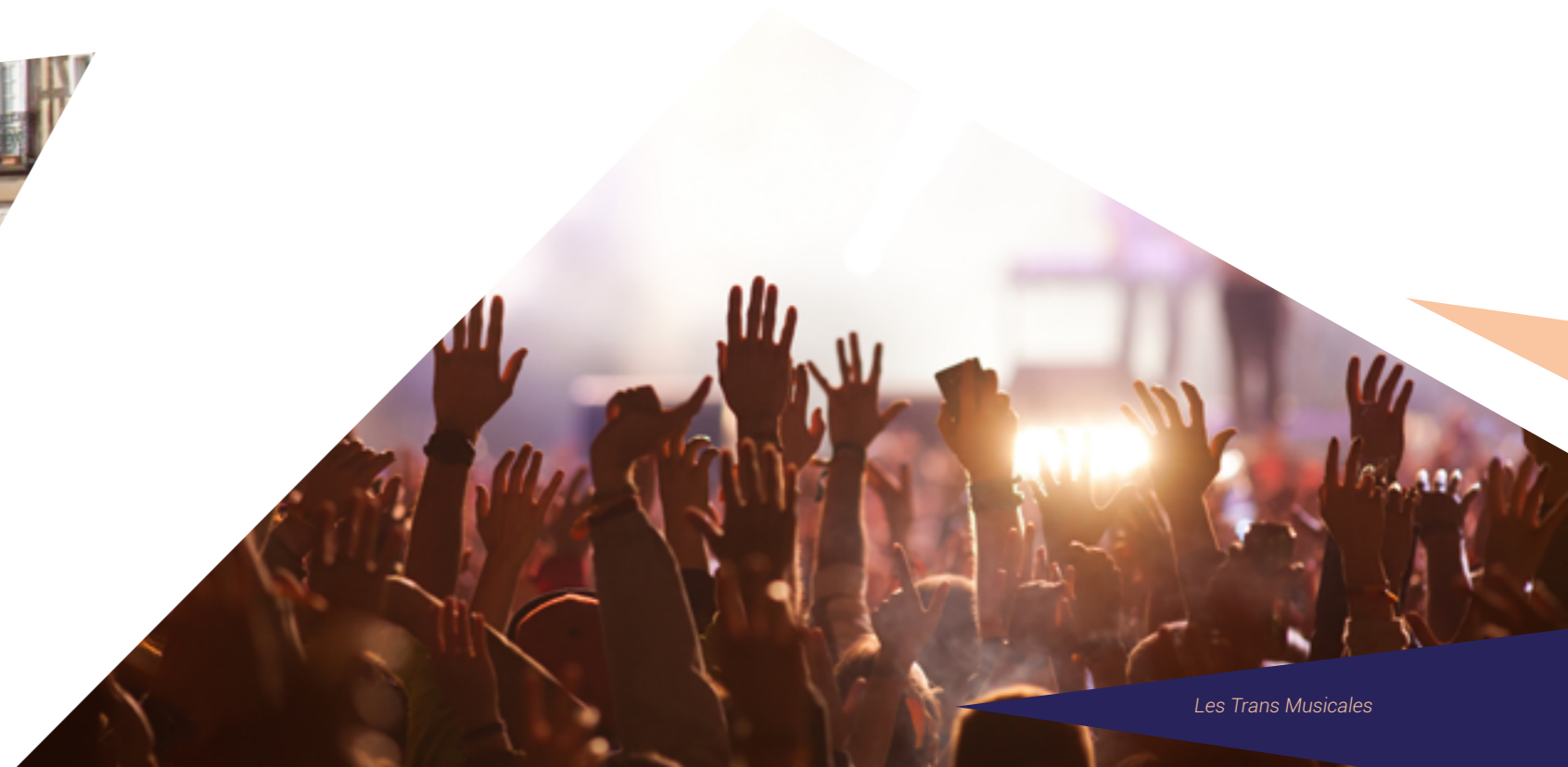
Les Trans Musicales

Les dimanches sont tout aussi animés à Rennes, avec des spectacles, des animations, des manifestations culturelles et sportives. Des événements partout dans la ville, pour faire de chaque dimanche un jour unique.