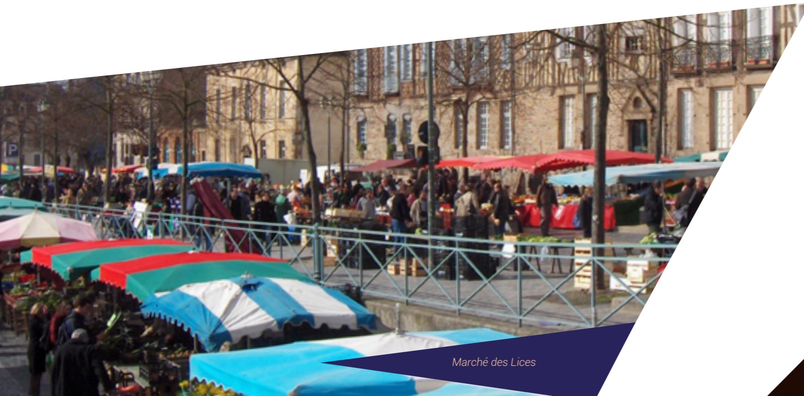
Marché des Lices

Crêpes ou galettes ? Blé ou sarrasin ? Salé ou sucré ? Faites votre choix dans les nombreuses et délicieuses crêperies bretonnes de la ville. Laissez-vous tenter par les bistrotts à vin conviviaux et les tables gastronomiques audacieuses. À Rennes, la tradition culinaire s'associe à la créativité pour le plaisir de vos papilles.