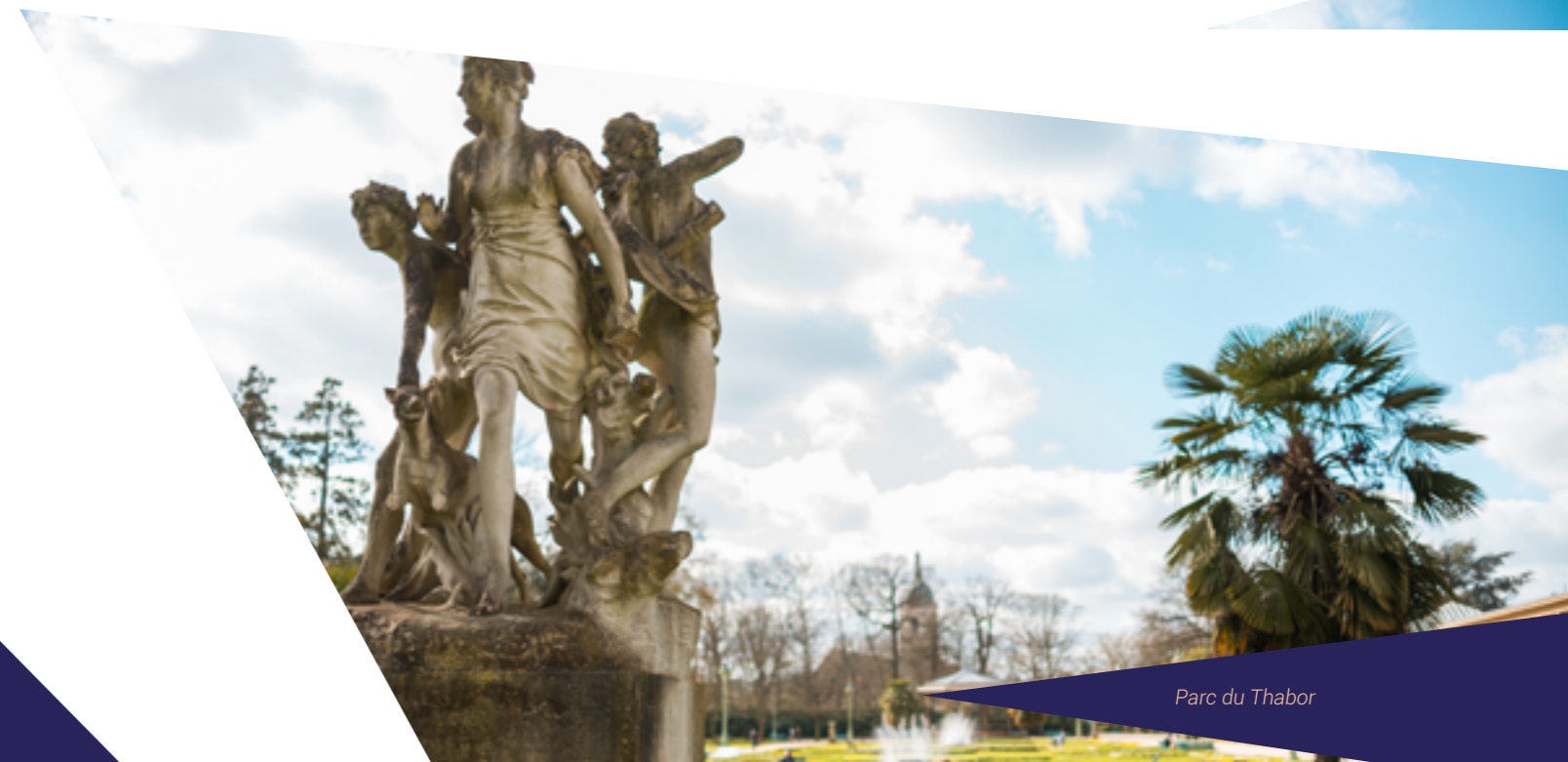
Parc du Thabor

Les Champs Libres regroupent le Musée de Bretagne, l'Espace des Sciences et son planétarium ainsi que la Bibliothèque de Rennes. Expositions et installations, arts visuels, arts numériques, performances littéraires et artistiques se côtoient dans ce lieu culturel bouillonnant.