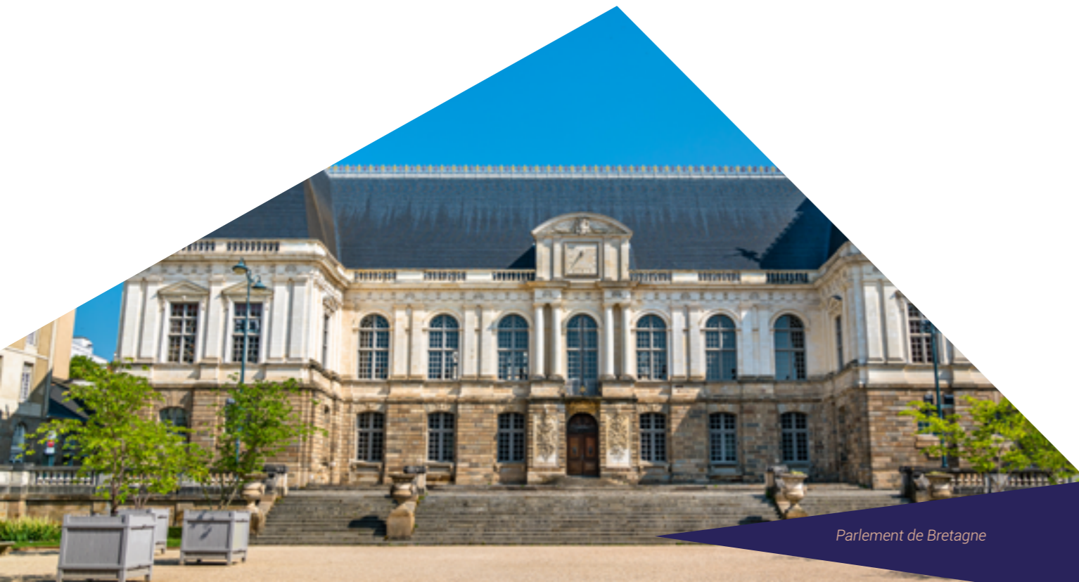
Parlement de Bretagne

Le Palais du Parlement de Bretagne est un des symboles de la Bretagne, conçu au XVII e siècle par l'architecte du Palais du Luxembourg, Salomon de Brosse. Il abrite la Cour d'Appel de la Bretagne et la Cour d'assises d'Ille-et-Vilaine. Magnifiquement restauré suite à l'incendie de 1994, sa visite permet d'admirer les peintures et dorures, notamment celles de la Grand'Chambre dont le plafond sculpté est unique en Europe.