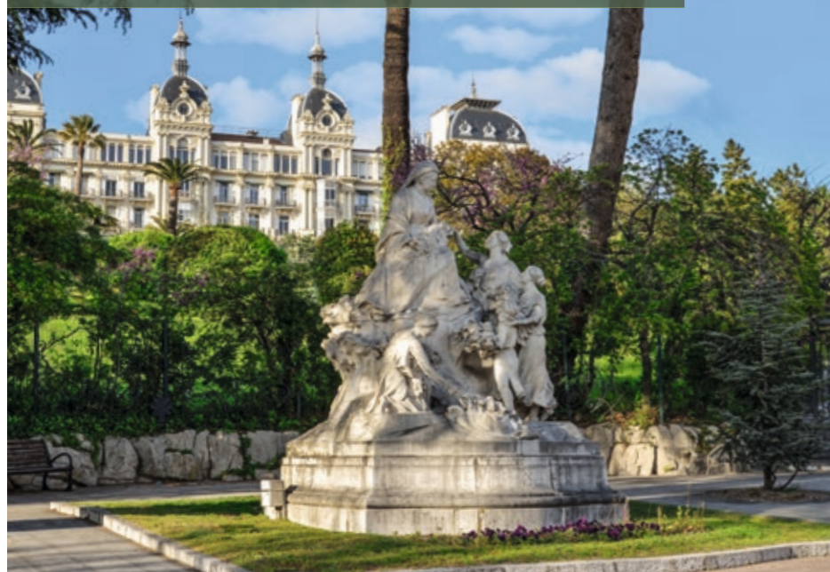
L'Excelsior Regina Palace, ancien hôtel de luxe qui accueillit la reine Victoria

Nice a toujours eu deux visages, complémentaires. Déjà sous l'Antiquité, les Romains avaient investi les collines, et les Grecs le bord de mer, avec Nikaïa. Entre Gairaut et Cimiez, la colline de Rimiez embrasse du regard la baie des Anges et les collines niçoises, alliant centralité et panorama époustoufflant. Une situation résidentielle recherchée pour sa qualité de vie sereine et pratique pour le plus grand bonheur de toute la famille.