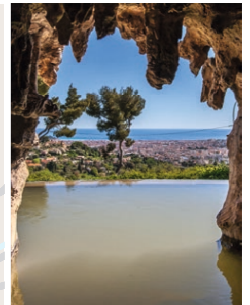
La cascade de Gairaut face à la Baie des Anges

« Une adresse de charme, dans la verdure et proche du centre, l'assurance d'une qualité de vie rare et d'un patrimoine pérenne. »