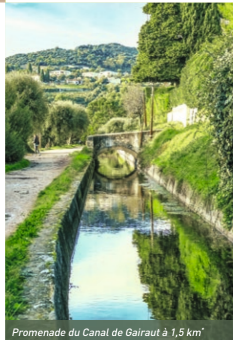
Promenade du Canal de Gairaut à 1,5 km