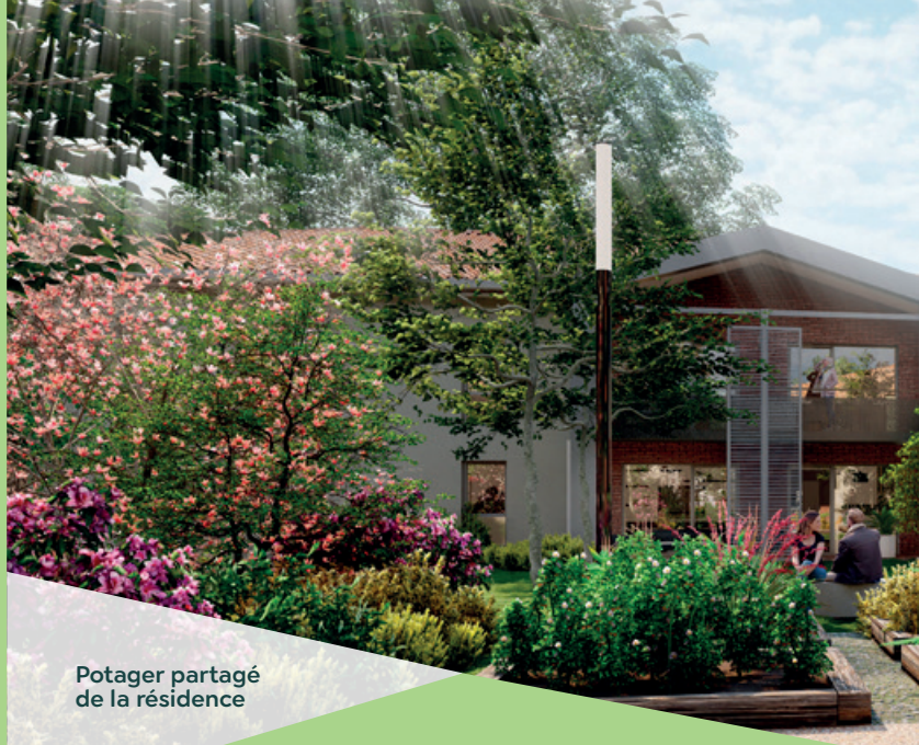
Potager partagé de la résidence