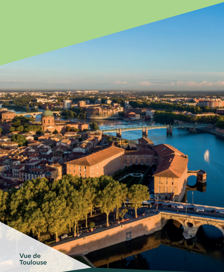
Vue de Toulouse

Côté transports, la commune est desservie par le train qui relie Auch à Toulouse. Aussi, à l'horizon 2028, la nouvelle ligne de métro M3 reliera Colomiers au centre de Toulouse en passant par Blagnac et les secteurs d'activités de l'Est de la métropole. Aujourd'hui, la ligne C du TER offre une connexion directe avec le centre-ville.