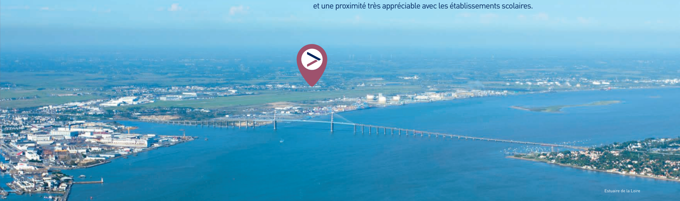
Estuaire de la Loire