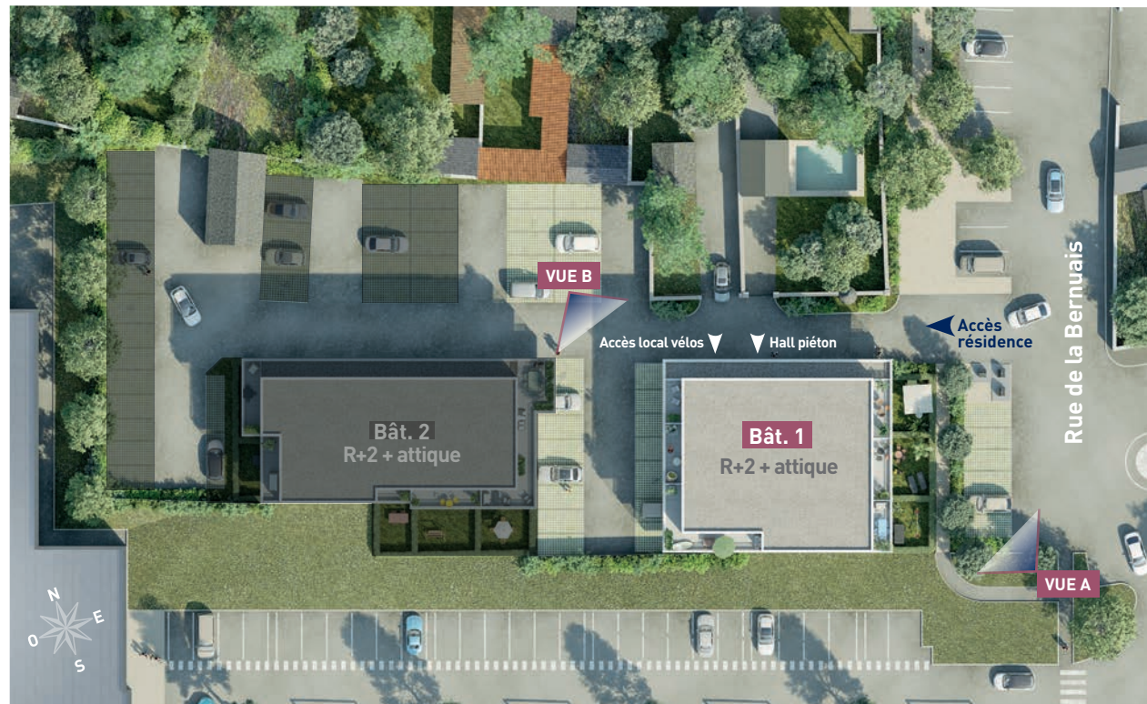
Plan de masse non-contractuel