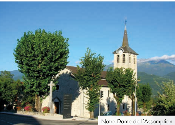
Notre Dame de l'Assomption