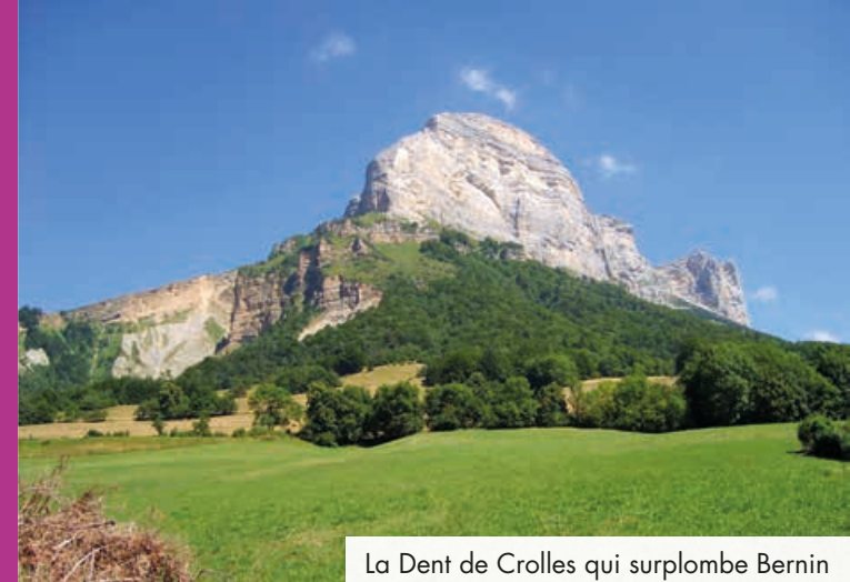
La Dent de Crolles qui surplombe Bernin