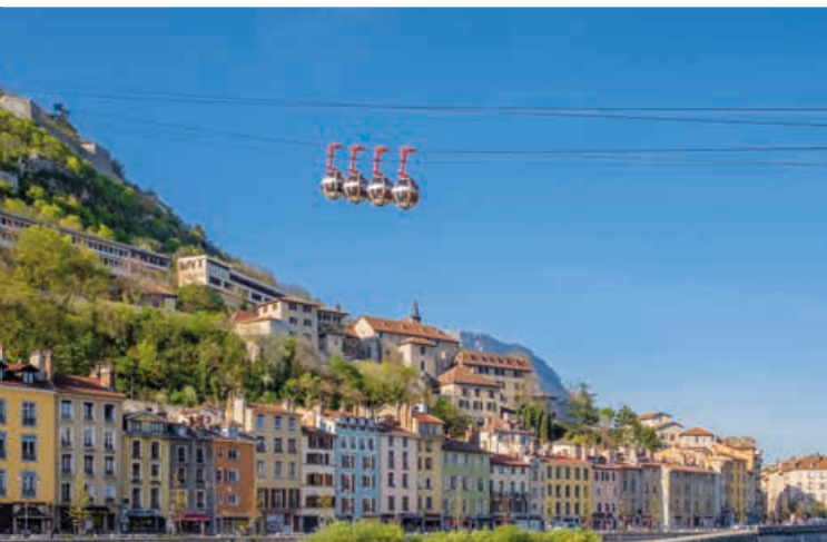
Grenoble, ses quais et son téléphérique à 18 min* de la résidence