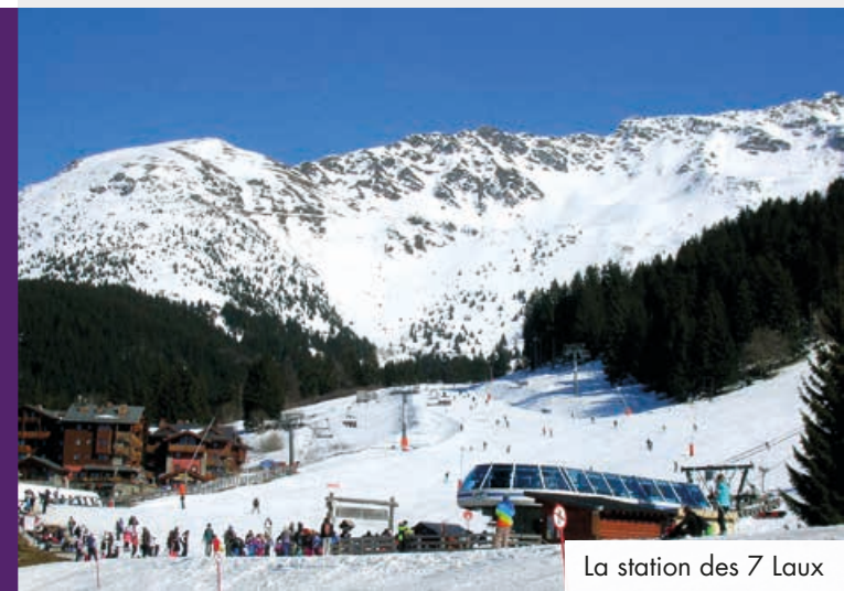
La station des 7 Laux