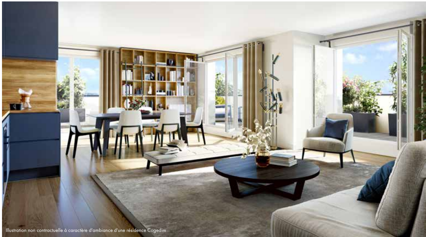
Illustration non contractuelle à caractère d'ambiance d'une résidence Cogedim

Ainsi, ces logements judicieusement pensés sont le compromis idéal entre le confort de l'appartement et la qualité de vie de la maison.