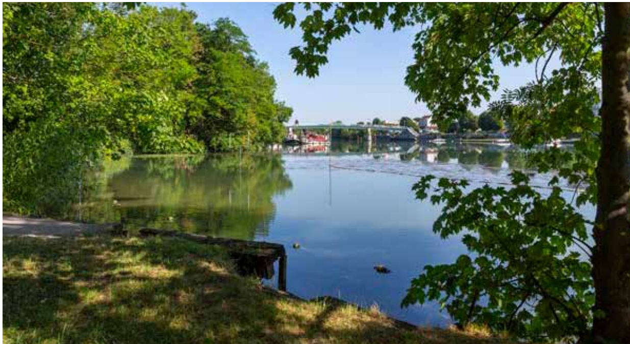
Les bords de Marne à 5 min* à vélo de la résidence

La douceur de vivre cristolienne s'apprécie aussi dans le quartier village, au sein du centre historique de la ville. Ses rues pavées, son marché, ses boutiques, ses commerces de bouche et ses terrasses de café distillent une ambiance conviviale et authentique.