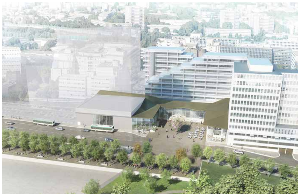
La future gare « Créteil-l'Échat » à 15 min* à pied de la résidence

Désormais, ce lieu de vie attractif gagne en qualité grâce à l'aménagement de la ZAC du Triangle de l'Échat. Elle se démarque notamment par une démarche éco-responsable et s'affirme comme une nouvelle entrée de ville dynamique et respectueuse de l'environnement.