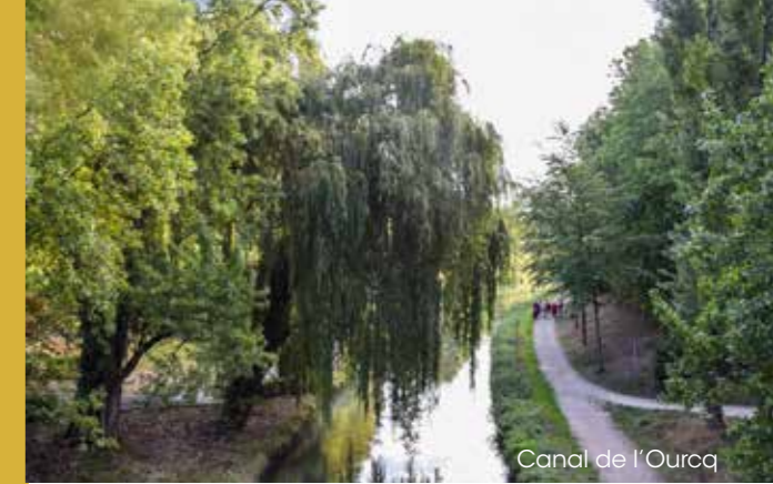
Canal de l'Ourcq

Des équipements scolaires (14 écoles maternelles et élémentaires - 2 collèges - 1 lycée) et de la petite enfance.