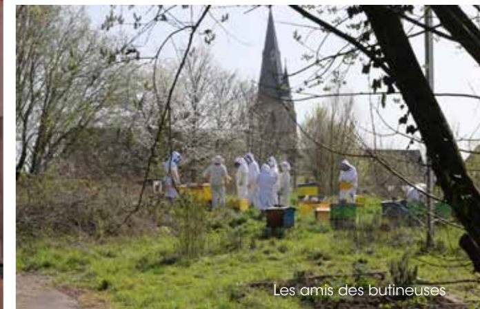
Les amis des butineuses