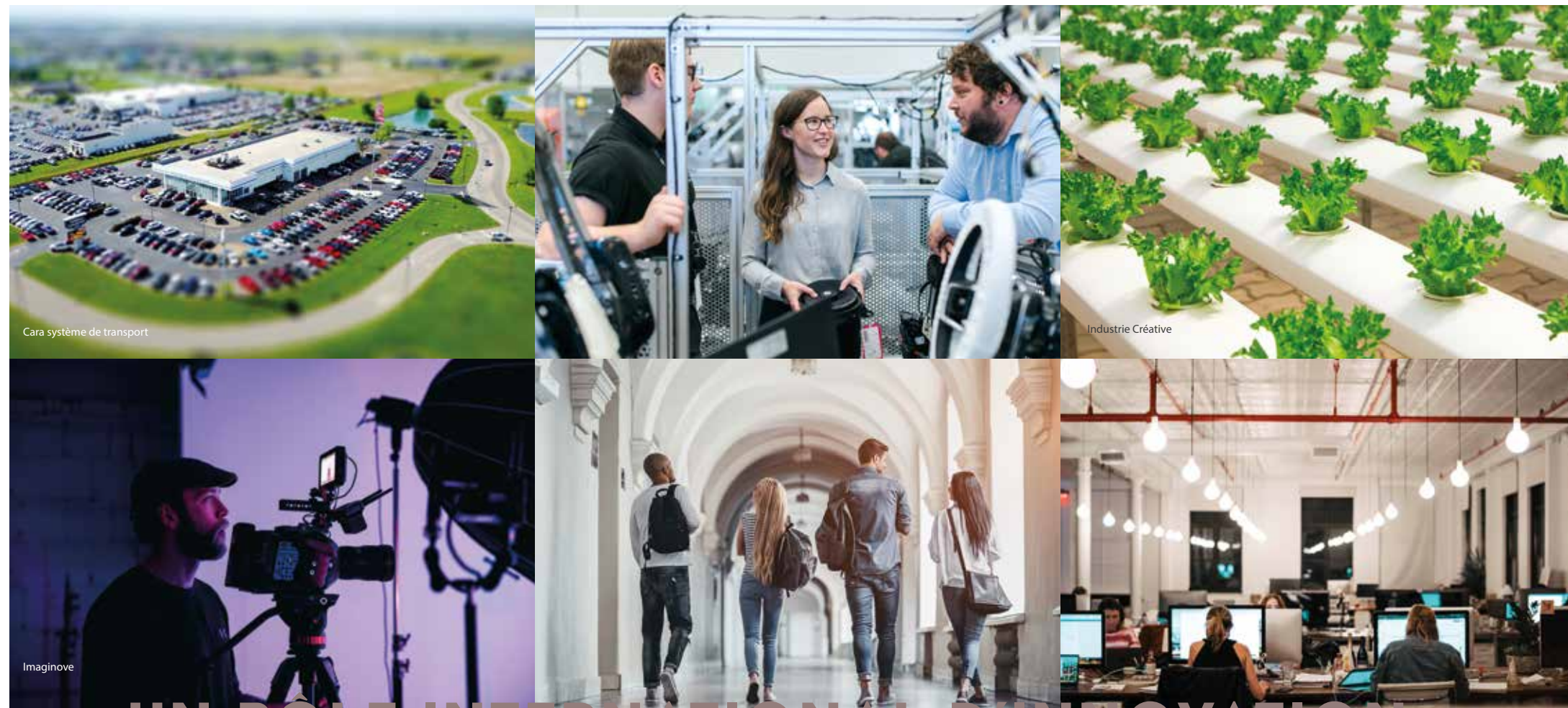
Cara système de transport

De plus en plus d'emplois dans l'économie sociale et solidaire