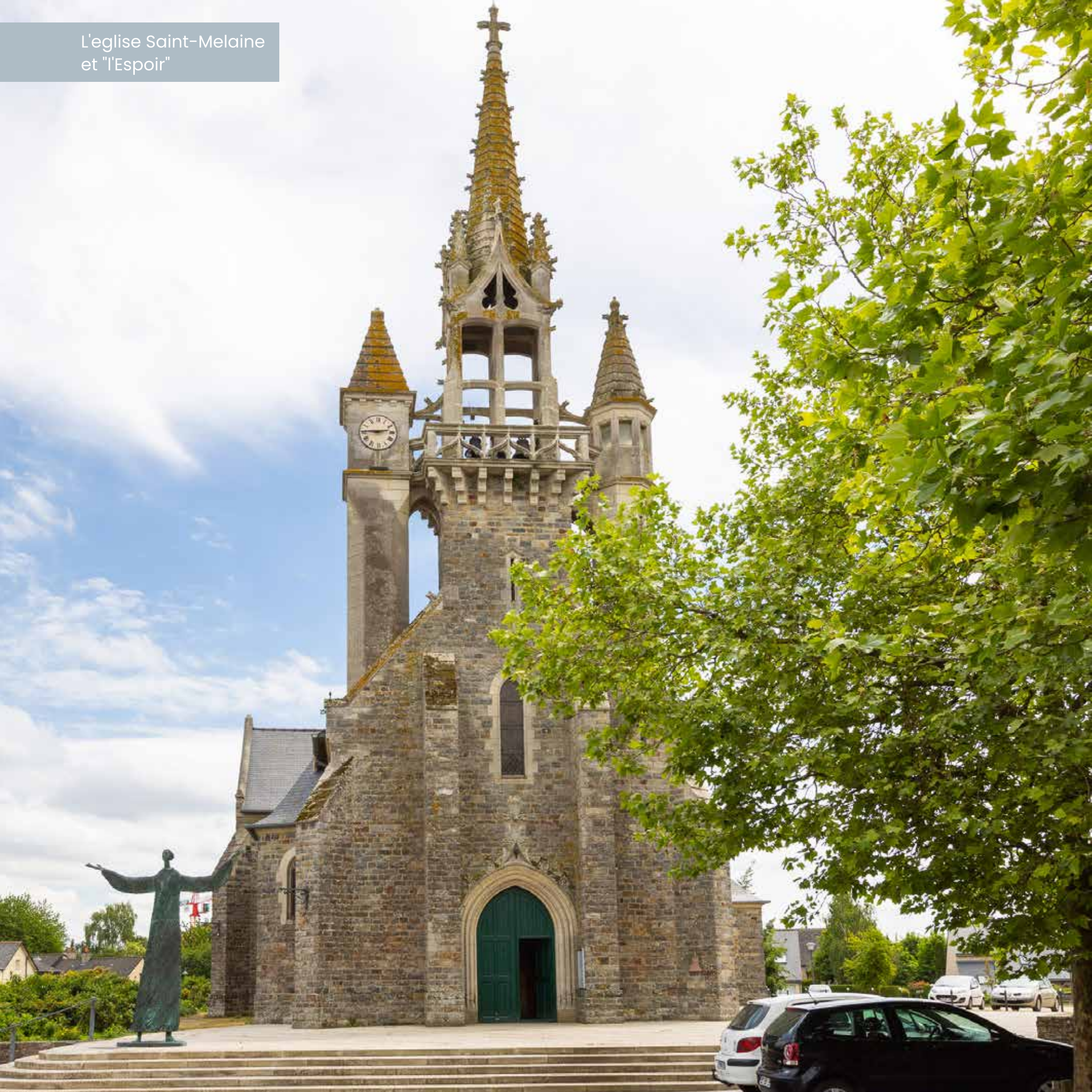
L'église Saint-Melaine et "l'Espoir"