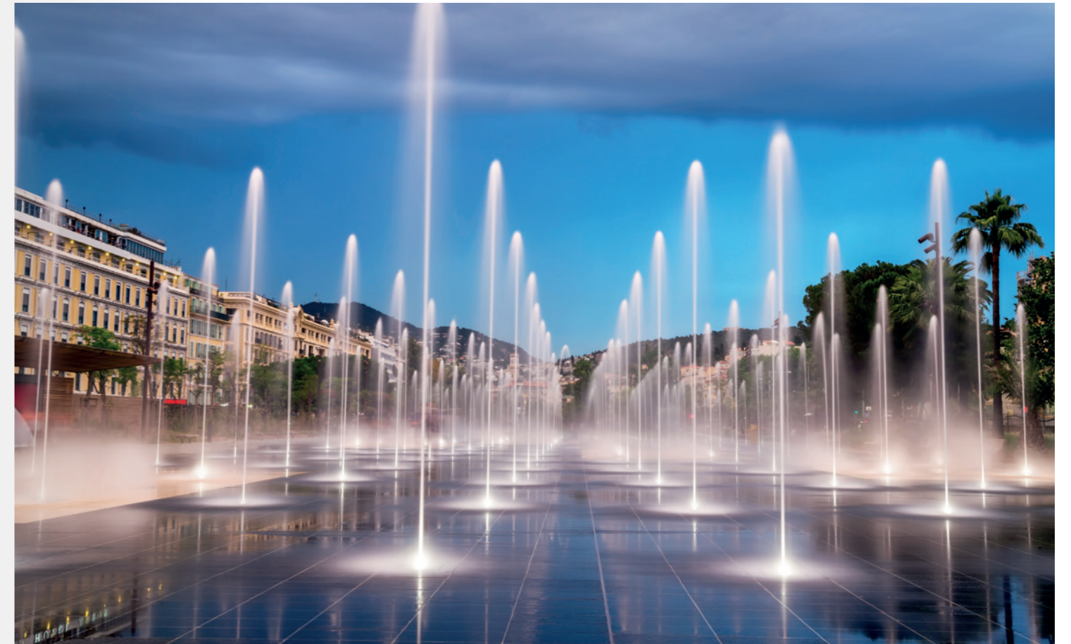
Les miroirs d'eau, promenade du Paillon, Nice

Aujourd'hui, les nouveaux aménagements de la Métropole Nice Côte d'Azur attirent des talents du monde entier et de grands projets porteurs d'activités.