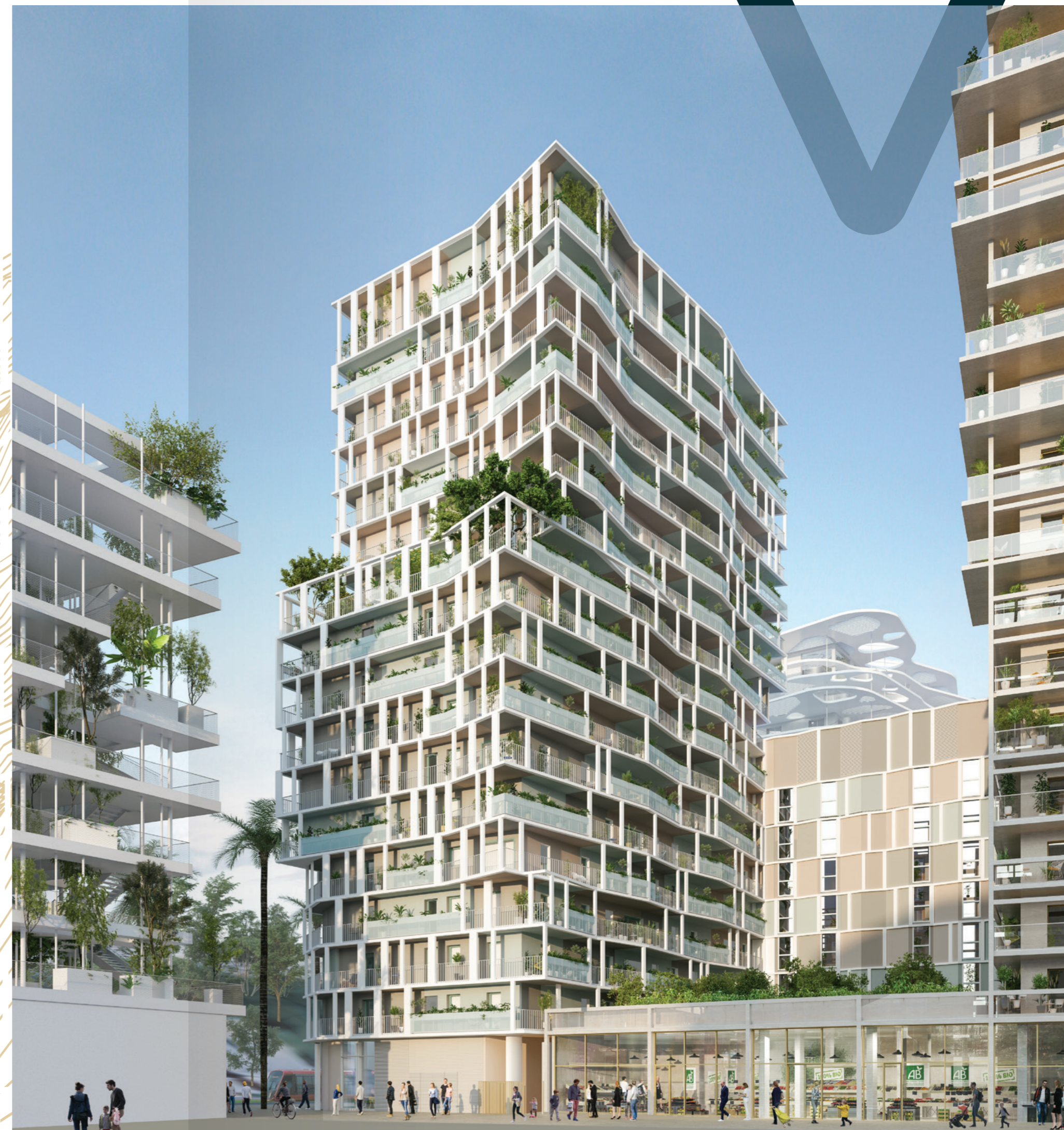
Résidence REVA, vue depuis le cours Méridia Nord