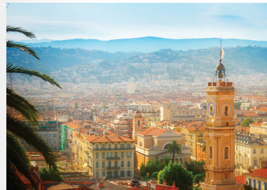
La tour Saint-François domine la vieille ville

Pionnière de la performance environnementale, Nice engage de nombreuses actions pour embellir son cadre urbain, réduire les dépenses d'énergie et développer la biodiversité.