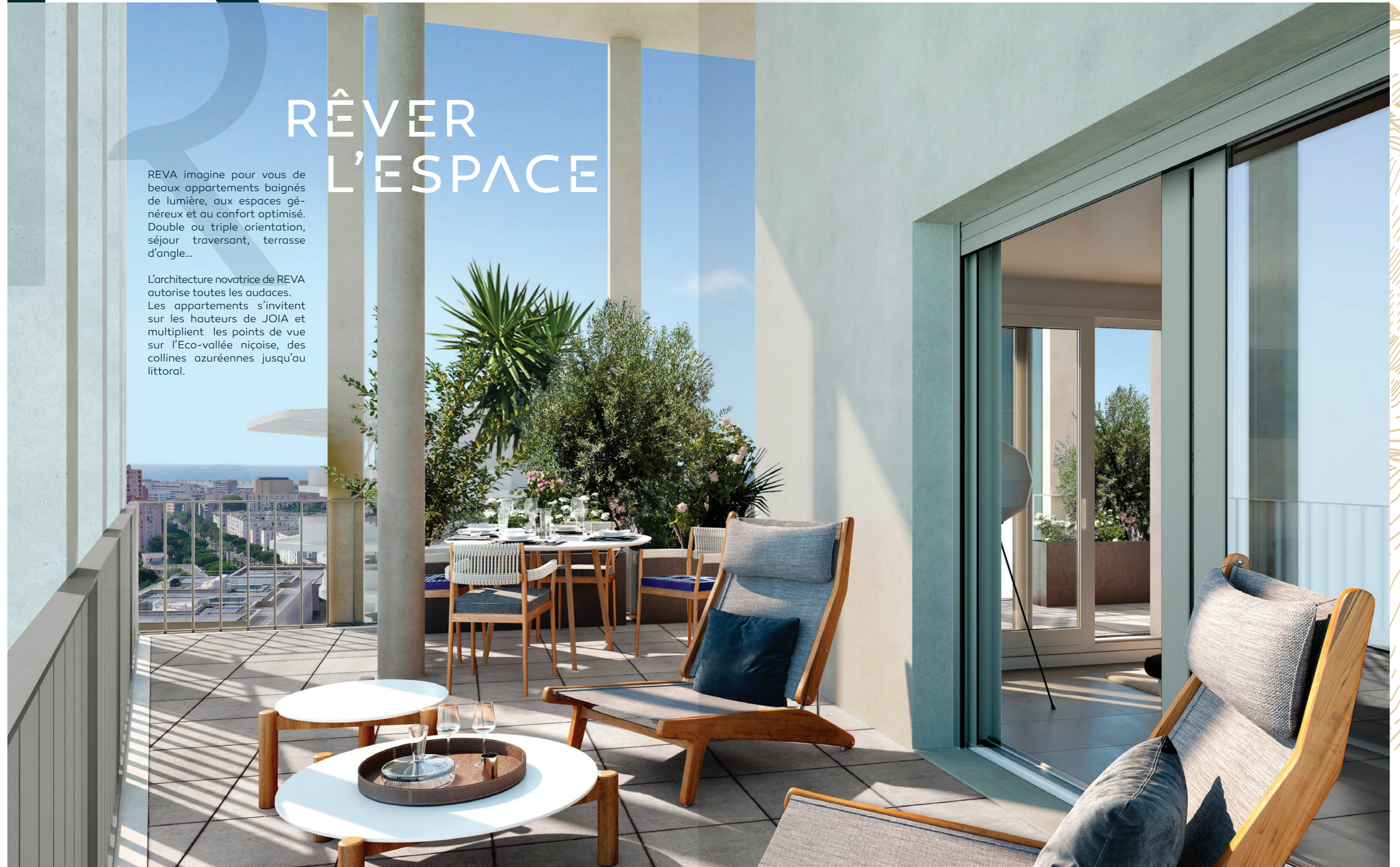
Résidence REVA, vue d'une terrasse au dernier étage

L'architecture novatrice de REVA autorise toutes les audaces. Les appartements s'invitent sur les hauteurs de JOIA et multiplient les points de vue sur l'Eco-vallée niçoise, des collines azurées jusqu'au littoral.