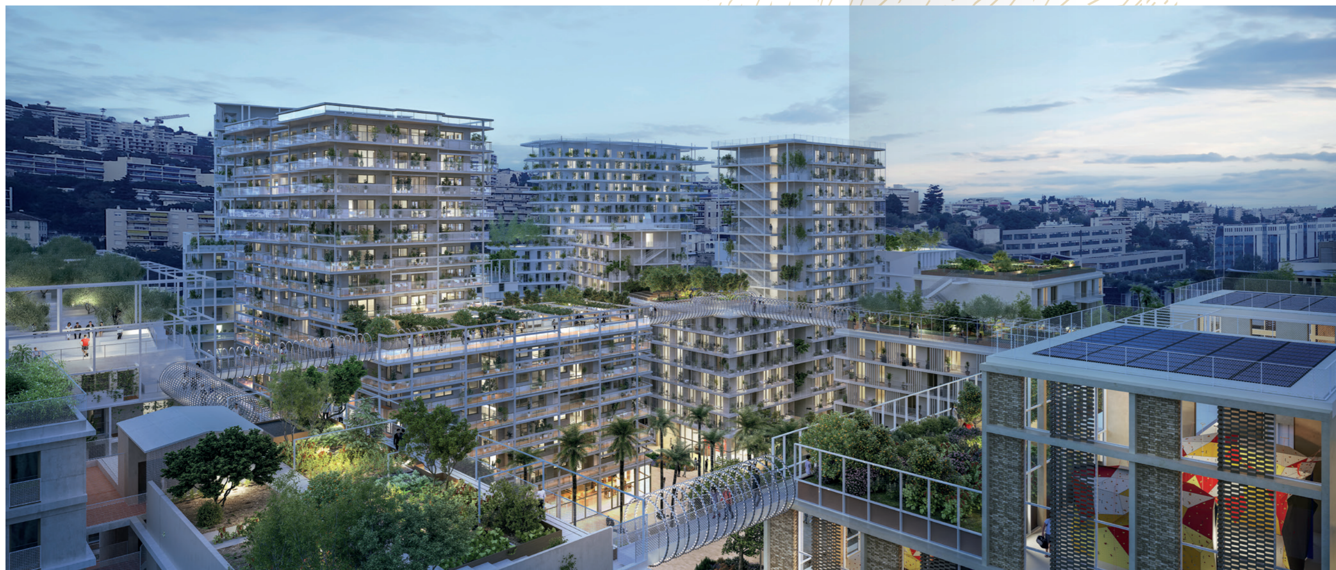
Vue générale de Joia

Au cœur de la Plaine du Var, JOIA vous offre une qualité de vie durable.