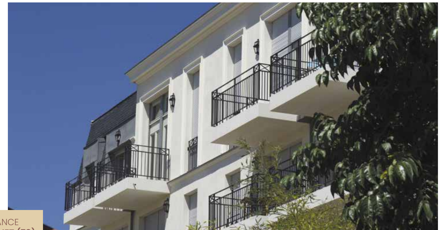
FRAGRANCE LE VÉSINET (78)