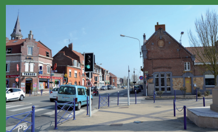
Rue nationale