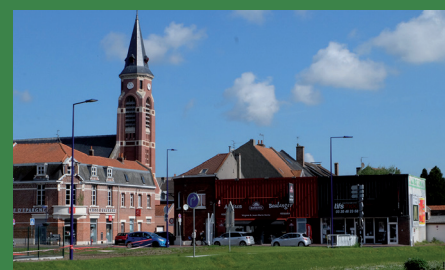
La Chapelle d'Armentières