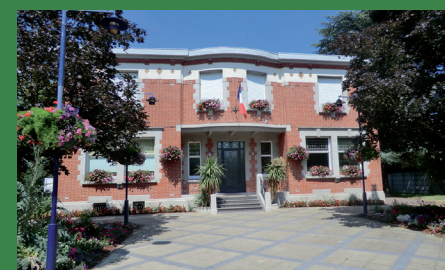
Mairie de la Chapelle d'Armentières - @wikipedia