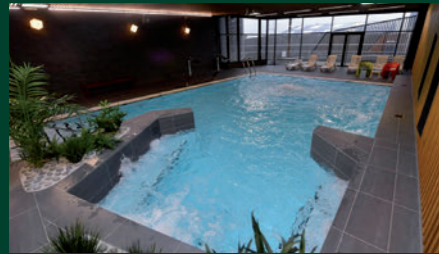
Piscine Zen & O

CREPS : centre de formation pour les métiers du sport