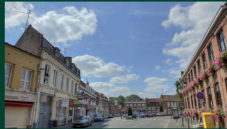
Place de la république