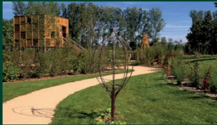
Jardin Mosaïc d'Houplin-Ancoisne