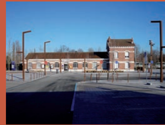
Gare de Templeuve