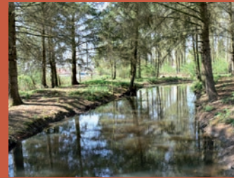
Etang d'Huquinville @villedetempleuve

Éducation : crèche, maternelles, primaires, collèges, lycées