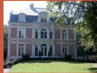
Mairie Château Baratte @villedetempleuve