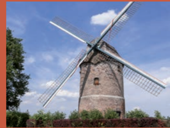
Le moulin de Vertain @google