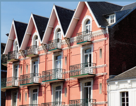
Les villas emblématiques de la station balnéaire