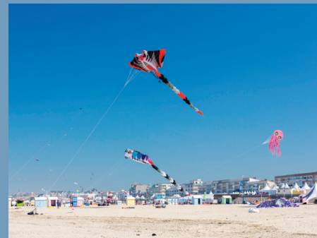
Les cerf-volants sur la grande plage