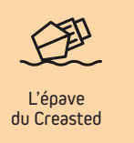
L'épave du Creasted