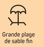
Grande plage de sable fin

L'ambiance chaleureuse de Zuydcoote se ressent aussi dans ses rues animées et ses marchés colorés, des instants inoubliables au bord de la mer, dans ce coin de paradis encore préservé.