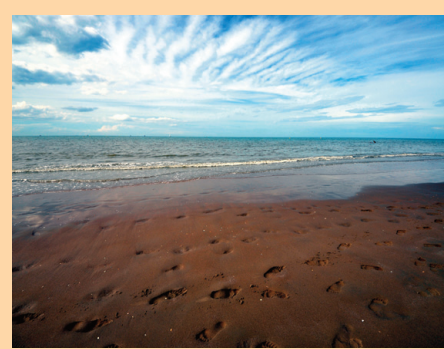
Promenade sur la grande plage