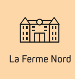
La Ferme Nord