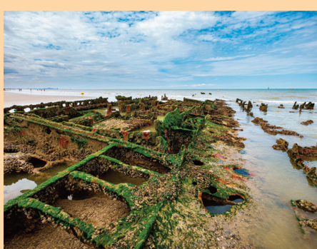
L'épave du Creasted