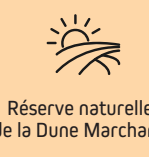
Réserve naturelle de la Dune Marchand