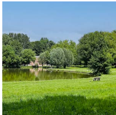
Parc de la Pescherie à 400 m* de la résidence