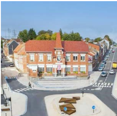
Mairie de Sainte-Catherine à 200m* de la résidence

Au quotidien, prenez le temps de vous ressourcer au fil de l'eau dans le parc de la Pescherie tout proche. Devant la résidence, deux arrêts de bus vous permettent de rejoindre rapidement le centre-ville d'Arras ou sa gare TER/TGV.