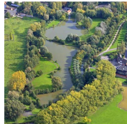
Rivière la Scarpe à 400 m* de la résidence