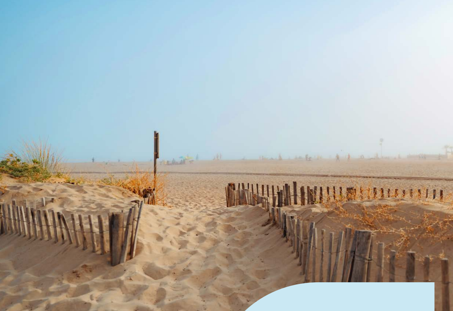
Valras-Plage, à 12 minutes de la résidence Sérène