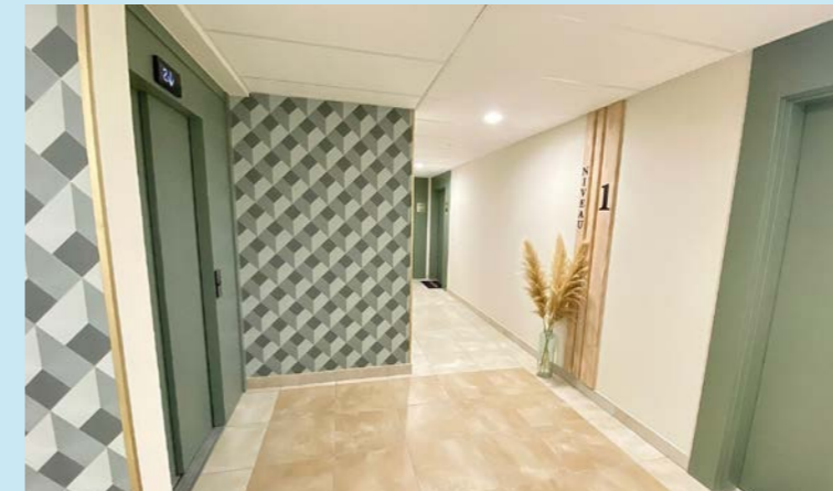
RÉSIDENCE VARIATIONS - NÎMES (30)

Pour vous, la garantie de pouvoir compter sur une réelle proximité.