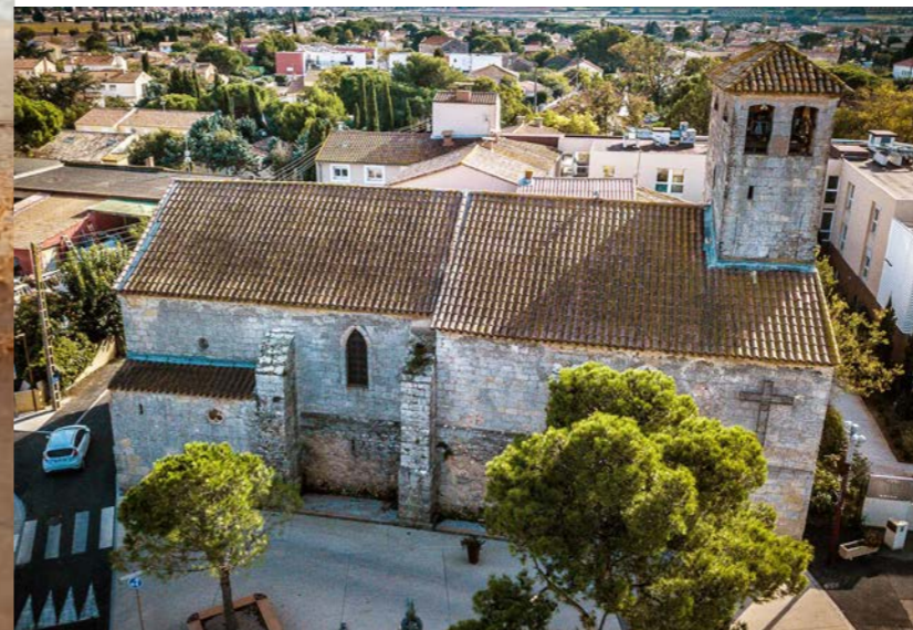
Le centre de Sauvian