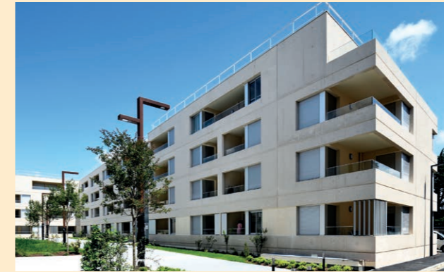
Résidence AVANT-GARDE à Bordeaux