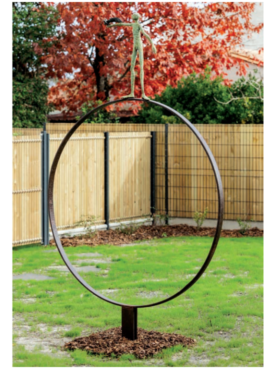
Sculpture de Sandrine SOURDET Résidence L'ESSAI à Saint-Médard en Jalles