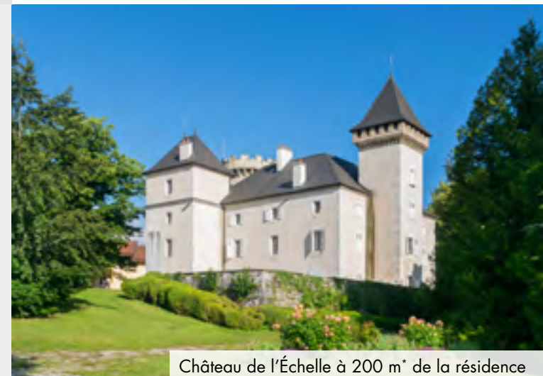
Château de l'Échelle à 200 m* de la résidence