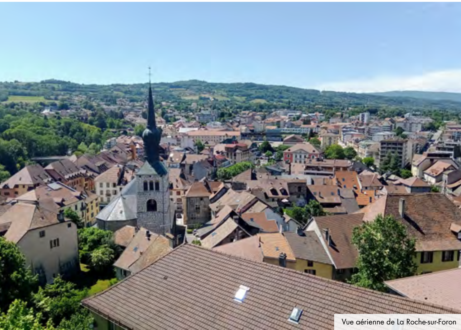
Vue aérienne de La Roche-sur-Foron