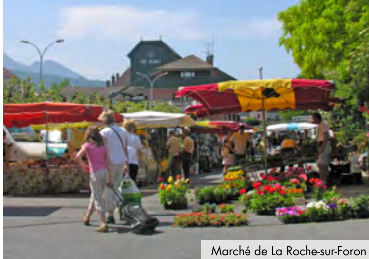
Marché de La Roche-sur-Foron

Fière de ses 3 fleurs au concours des Villes et Villages fleuris, La Roche-sur-Foron veille avec soin sur ses espaces verts.