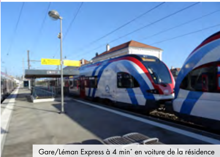
Gare/Léman Express à 4 min* en voiture de la résidence

Fière de ses 3 fleurs au concours des Villes et Villages fleuris, La Roche-sur-Foron veille avec soin sur ses espaces verts.