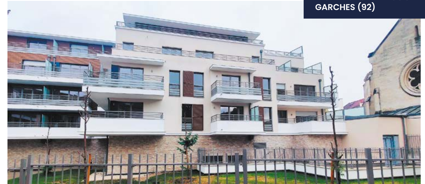
NOS EXEMPLES DE RÉALISATIONS EN ÎLE-DE-FRANCE