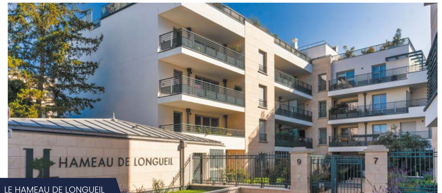
LE HAMEAU DE LONGUEIL MAISONS-LAFFITTE (78)