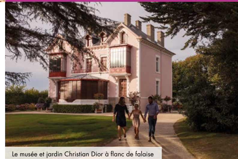
Le musée et jardin Christian Dior à flanc de falaise