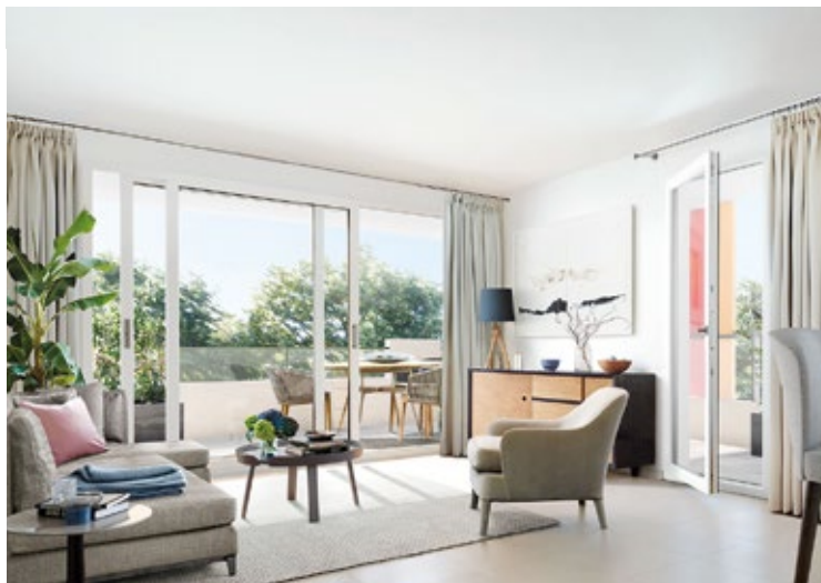
Illustration non contractuelle à caractère d'ambiance d'une opération Cogedim