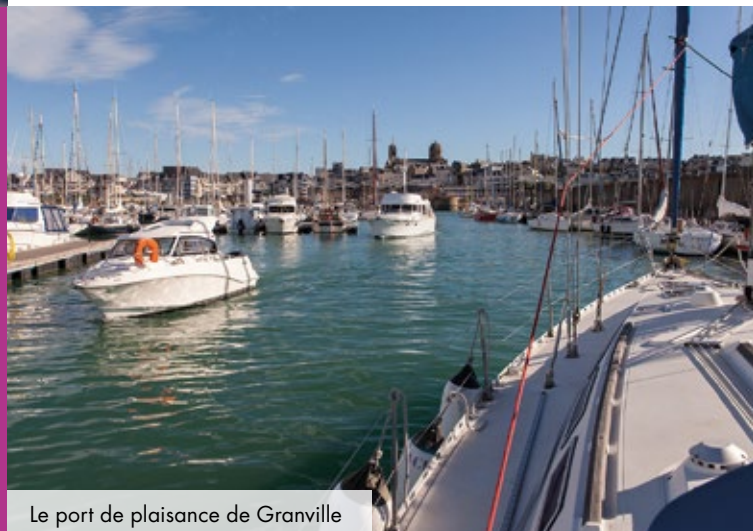
Le port de plaisance de Granville