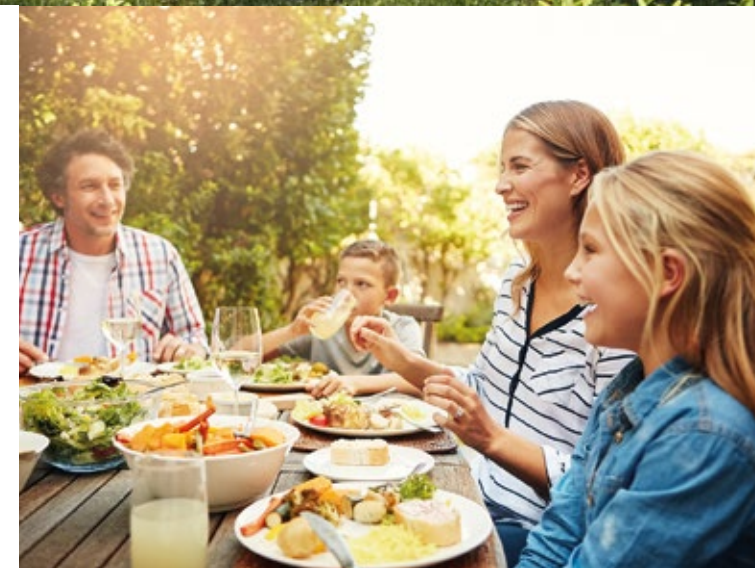
Illustration non contractuelle à caractère d'ambiance d'une opération Cogedim