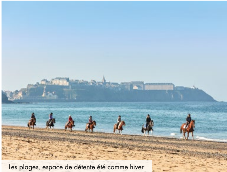
Les plages, espace de détente été comme hiver