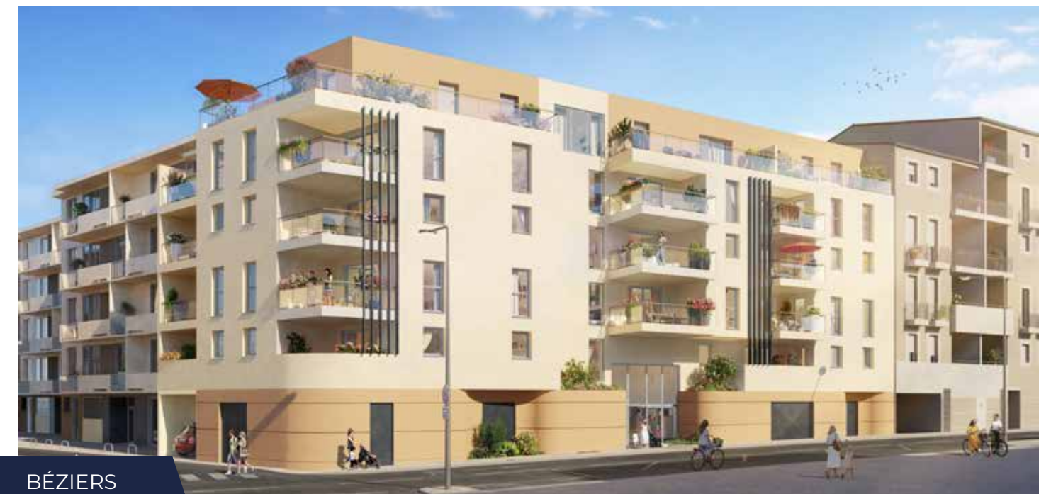
BÉZIERS OVÉA (34)