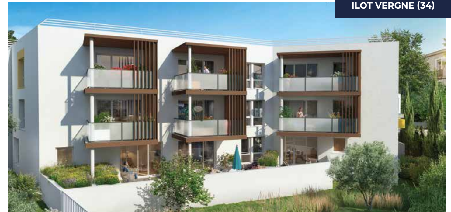
NOS EXEMPLES DE PROJETS EN COURS DANS LA RÉGION