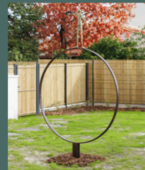
Sculpture de Sandrine SOURDET Résidence L'ESSAI à Saint-Médard-en-Jalles

Tout en soutenant les artistes et la création contemporaine française, VINCI Immobilier invite ainsi l'art dans le quotidien et dans la ville.