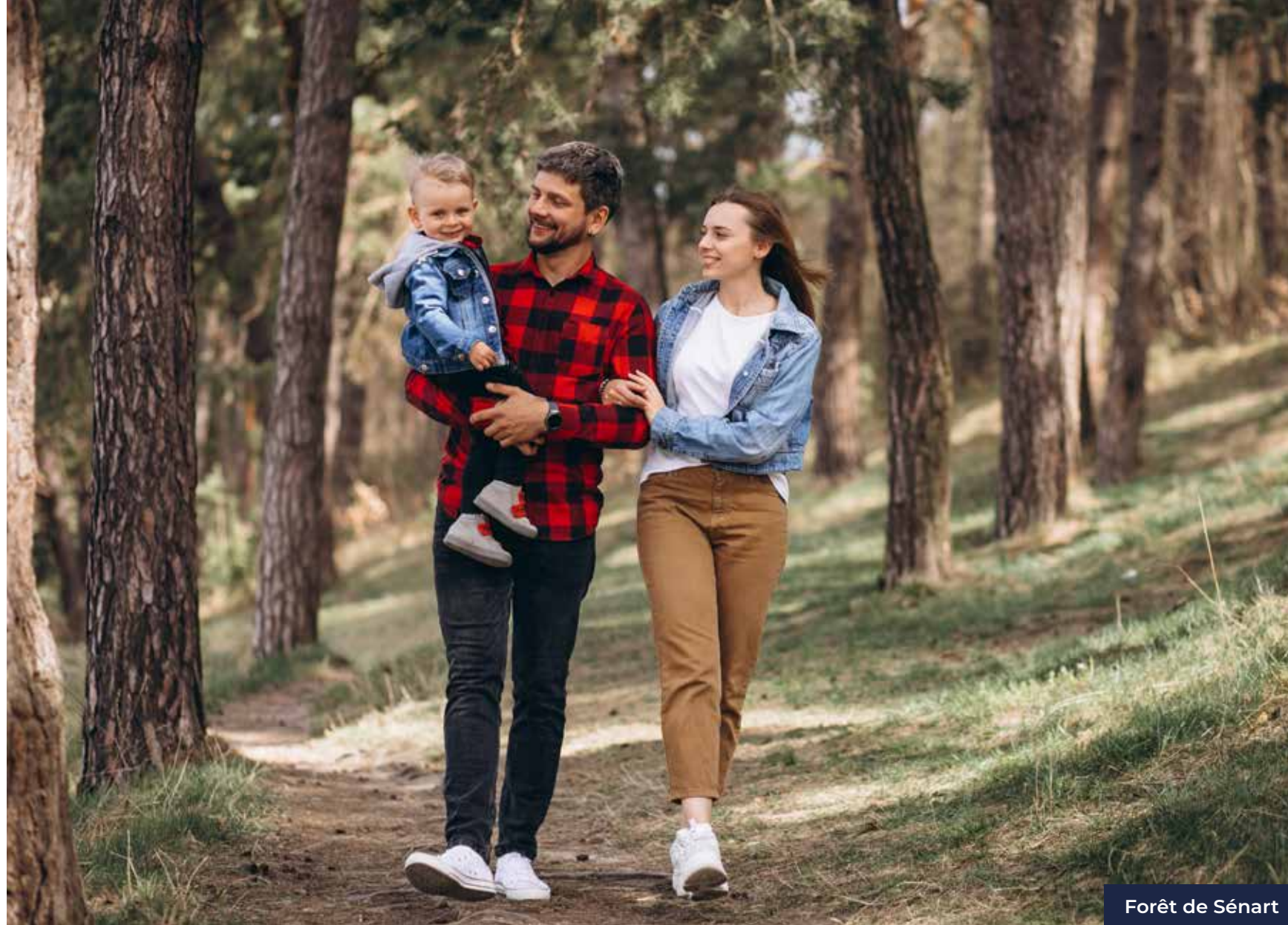
Forêt de Sénart