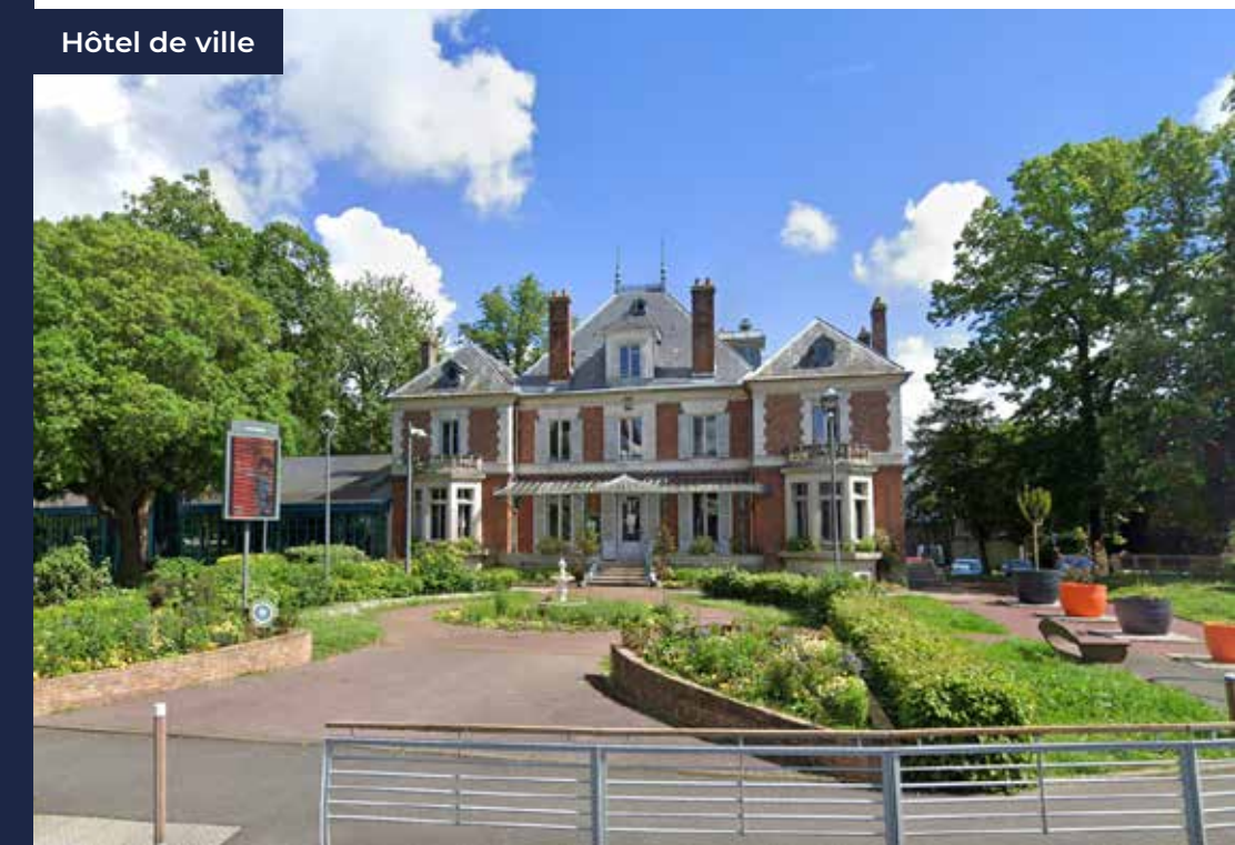
Hôtel de ville

Côté transports, la gare RER D « Boussy-Saint-Antoine » vous permet de rejoindre « Paris Gare de Lyon » en moins de 35 min*.