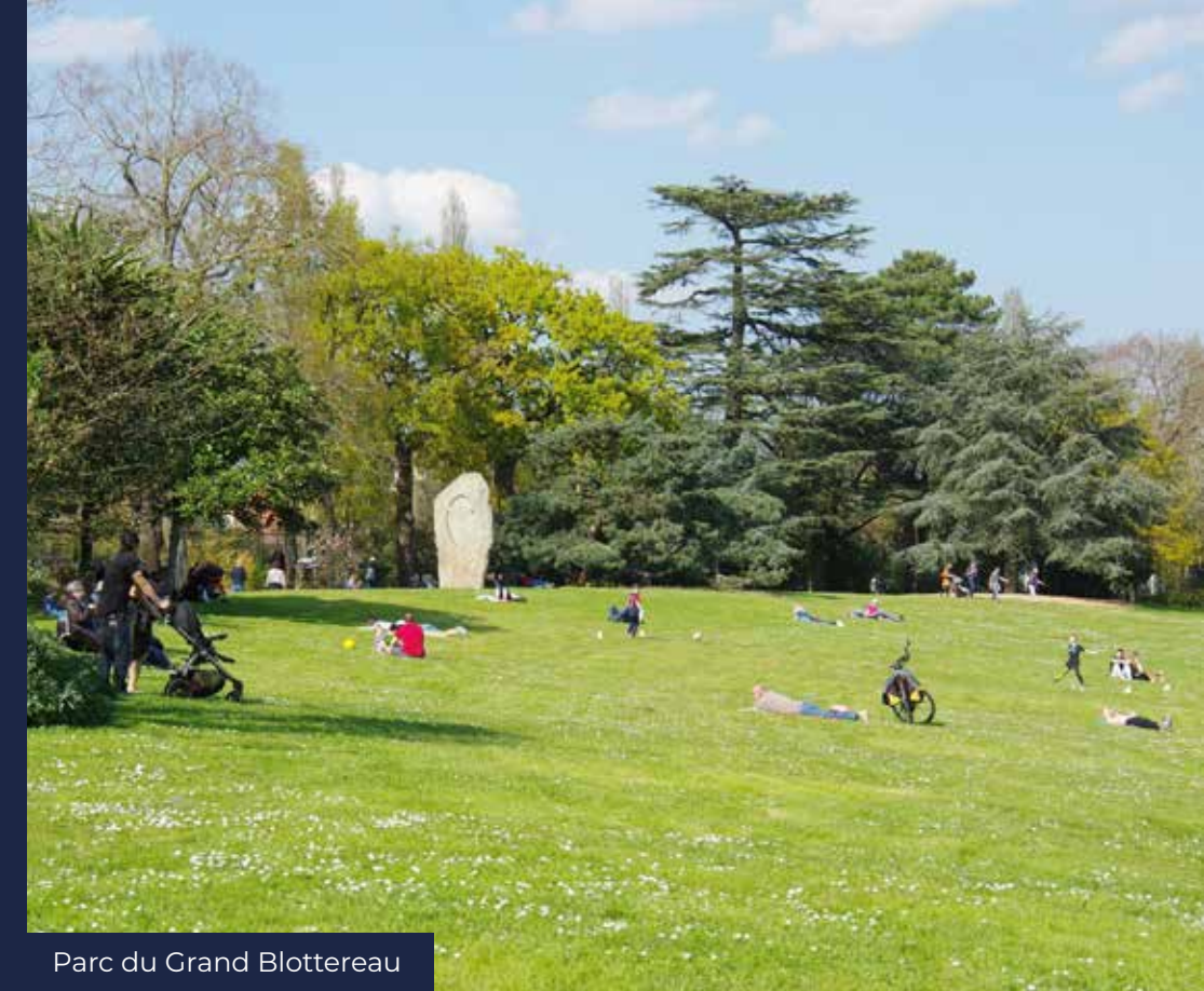
Parc du Grand Blottereau