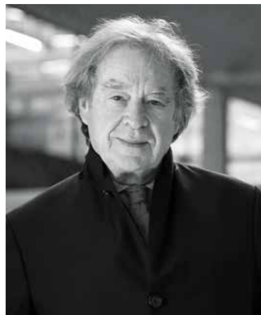
Jean-Michel Wilmotte, architecte, urbaniste, designer et académicien.

« Le projet EXCLUSIVE 8 e est marqué par l'omniprésence de la nature sur le terrain d'origine. Une trame végétale qui était si dense pour un cœur d'agglomération que nous l'avons érigée en fil rouge de notre travail. »