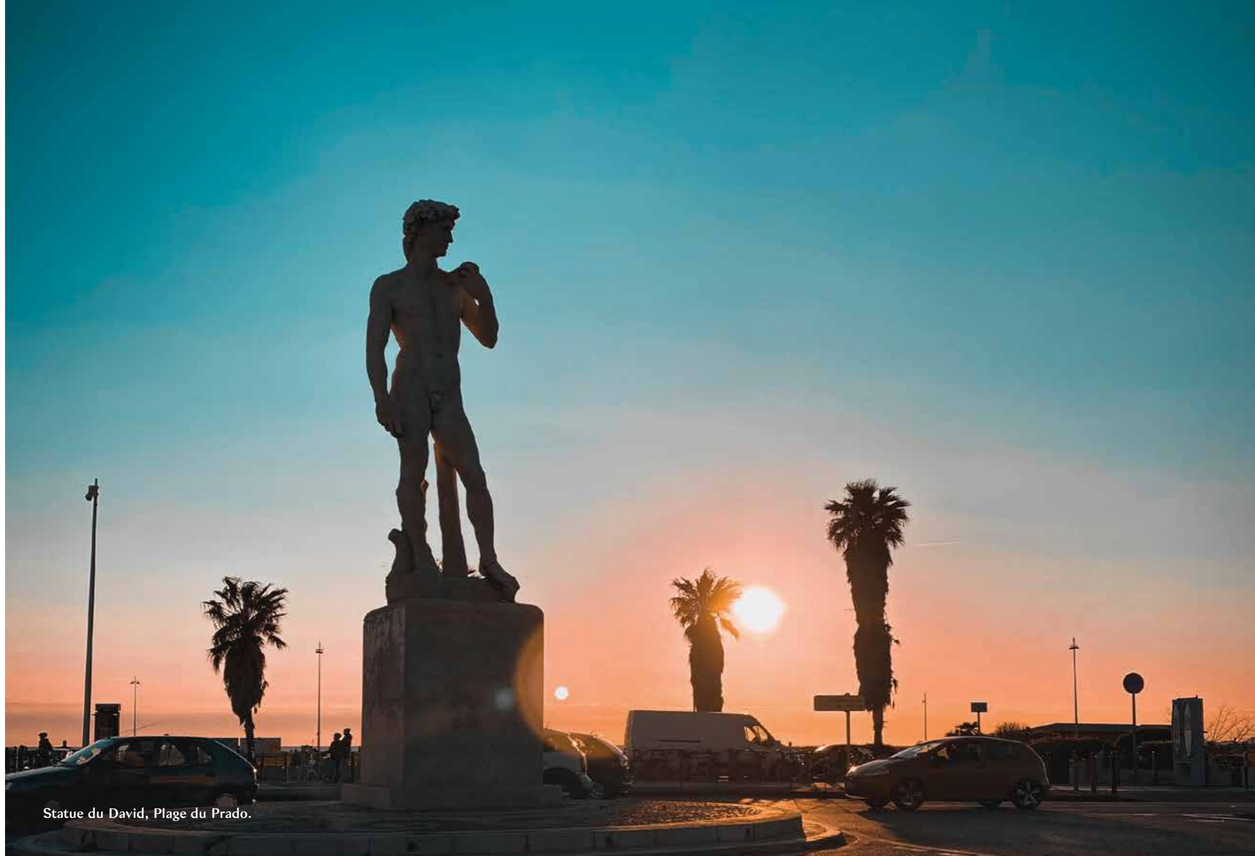
Statue du David, Plage du Prado.