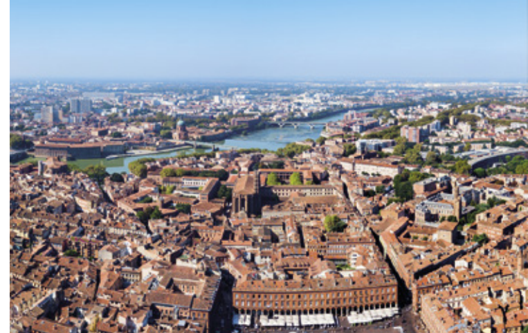
Le cœur historique de Toulouse accessible en métro ou en voiture à 10 min*

Fondée il y a 2 000 ans, Toulouse affiche avec fierté ses origines gallo-romaines, cathares et bien d'autres. Du Capitole aux Jacobins, de la place Saint-Georges à la place Wilson, la ville multiplie les charmes et les références historiques. Toulouse se love dans l'écrin sublime de la Garonne lui conférant des airs florentins. Mais la ville rose sait aussi vivre avec son temps comme en attestent ses nouveaux aménagements urbains et ses quartiers dernière génération répondant aux enjeux de la ville de demain.