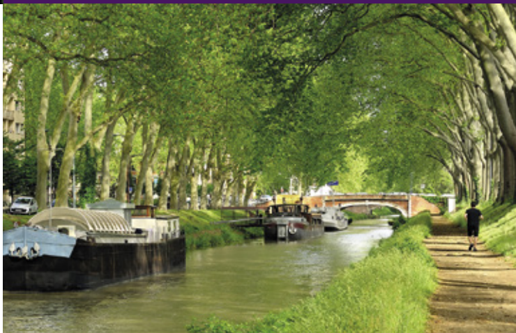
Jogging ou balade à vélo le long du canal du Midi