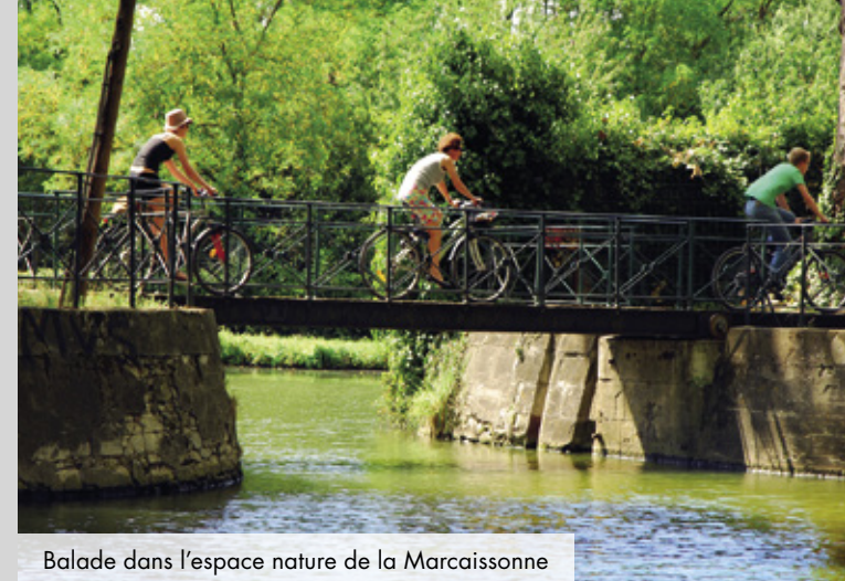
Balade dans l'espace nature de la Marcaissonne

« La rencontre d'un grand projet de ville et d'une ambition urbaine a donné naissance à un nouvel univers résidentiel, un mode de vie adapté à toutes les envies... »