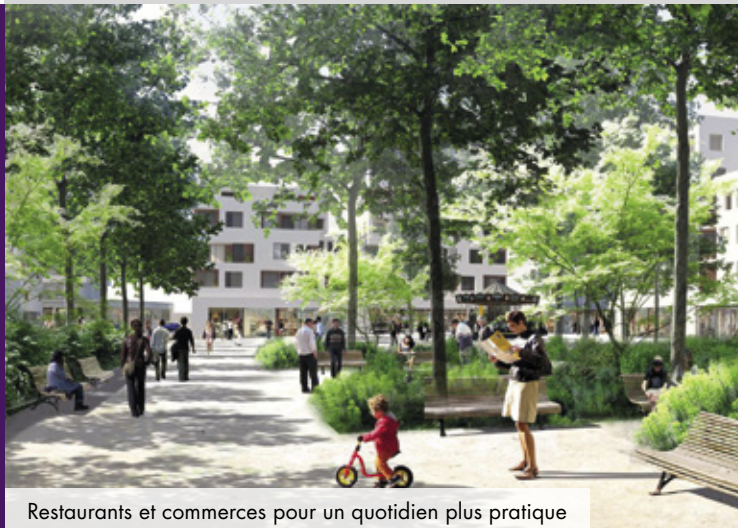
Restaurants et commerces pour un quotidien plus pratique

Une ville + connectée : à 12 min* du Capitole en voiture et des transports renforcés par une nouvelle liaison routière et la 3 e ligne de métro accessible par la ligne de bus Linéo 7 à haut niveau de service.