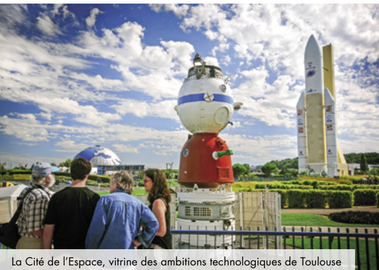
La Cité de l'Espace, vitrine des ambitions technologiques de Toulouse