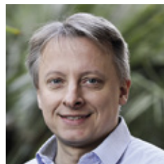
Maxime Thomas Woodstock Paysages

« Le végétal a fait partie intégrante de notre réflexion afin de créer un aménagement aéré, un îlot résidentiel avec 2 500 m 2 d'espaces paysagers, s'accordant avec le parc voisin pour devenir une respiration verte en ville à destination de ses résidents, pour une vie plus douce, plus verte.